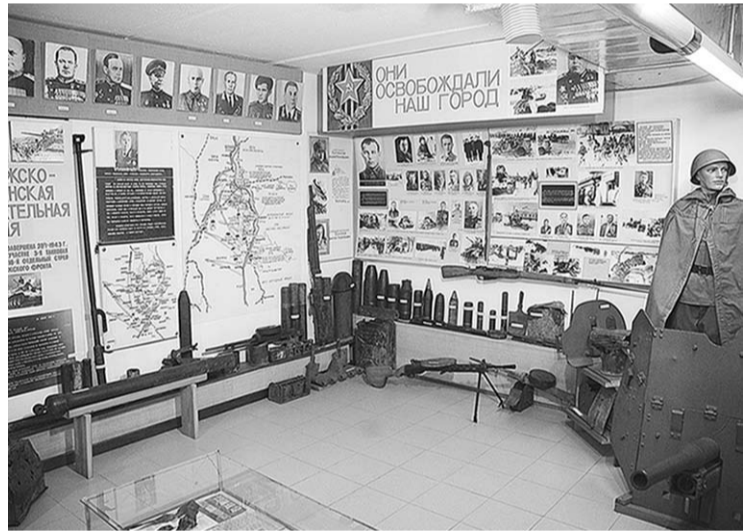
Подвигу советских солдат, освободивших Россошь, посвящён отдельный зал в местном музее.