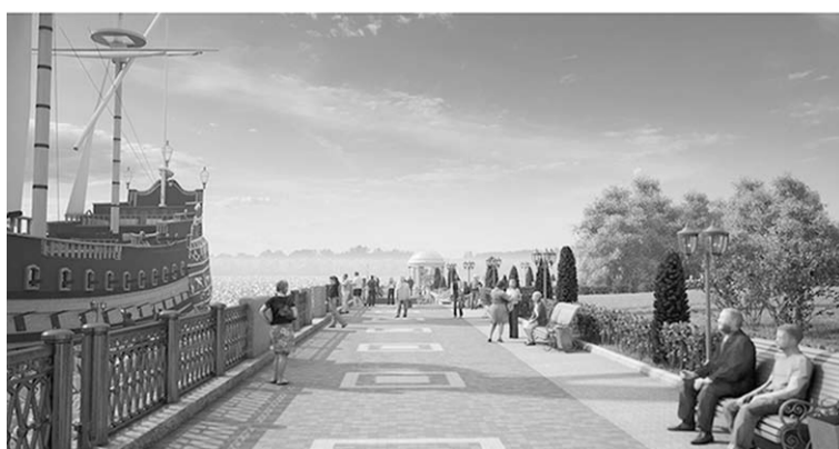
Таким мы увидим музей-корабль.

Проект значимый и находится под личным контролем губернатора Алексея Гордеева. Аукцион на строительство береговой линии объявили ещё 11 января. По условиям контракта подрядчик должен завершить работы к 10 июля, чтобы сдать объект 30 июля нынешнего года.