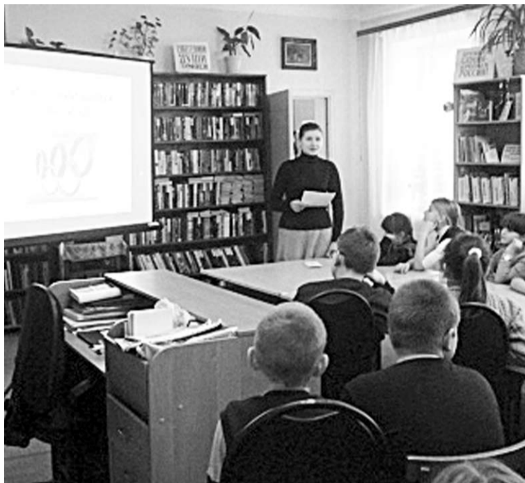
Школьникам рассказали об истории Олимпийских игр.

Во время её презентации в гости к ребятам пришли талисманы Олимпиады-2014: Белый Мишка, Зайка и Леопард Барсик. Каждый – с интересной историей о себе.