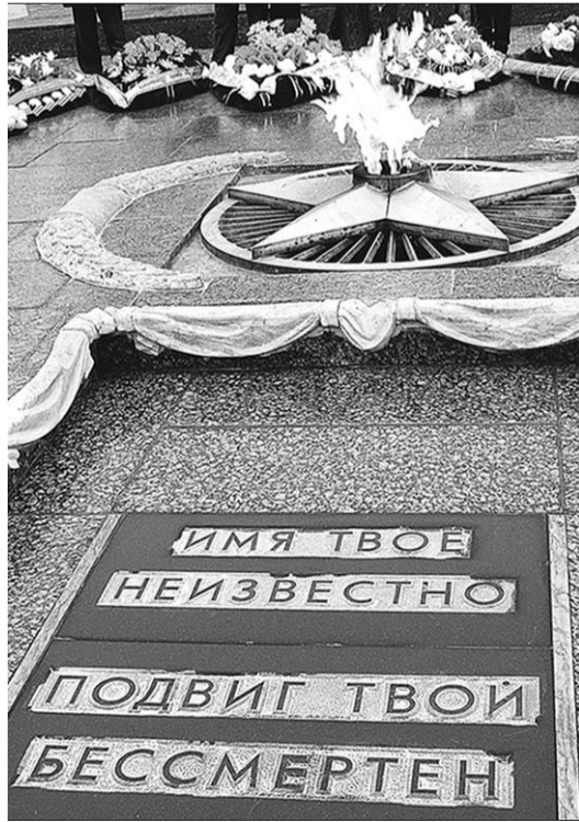
В последние годы на братских могилах появилось много прежде не обозначенных имён павших солдат.