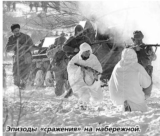
Эпизоды «сражения» на набережной.