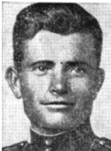
Герой Советского Союза Фёдор Кобец.

В Смоленском сражении его 57-я танковая дивизия на восемь (!) дней задержала на подступах к Днепру