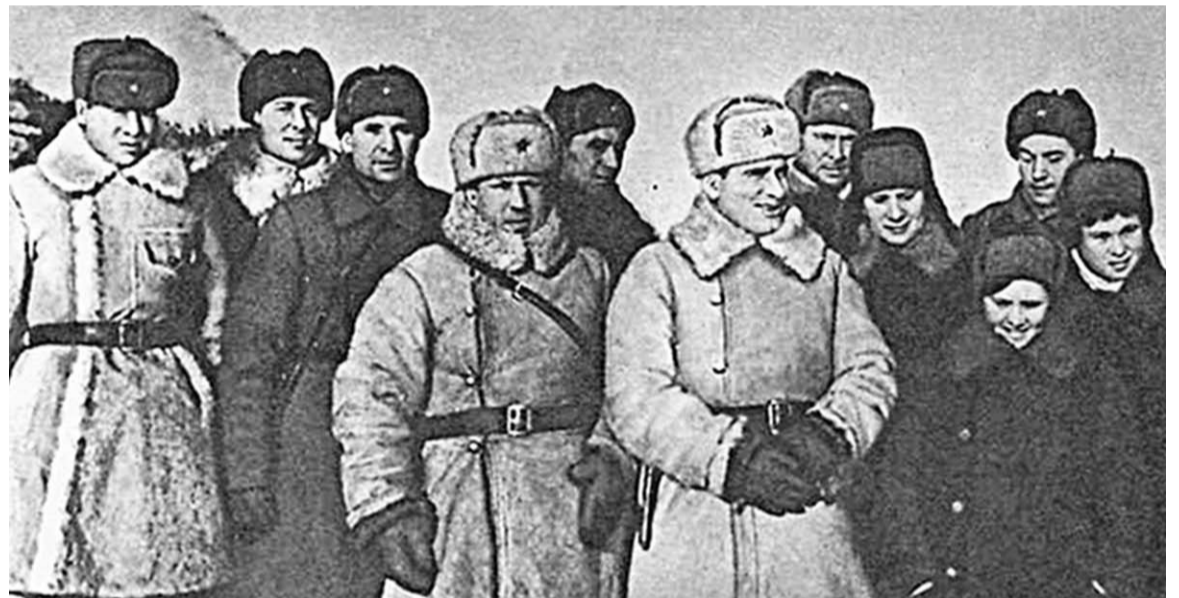
Делегация воронежских колхозников в гостях у воинов 1-го механизированного корпуса.