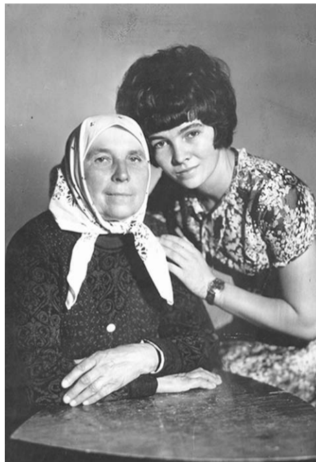
С любимой бабушкой.

кусочки детских тел, уложила их в гробики, прикрыла одеждой, поддерживала родителей и родственников.