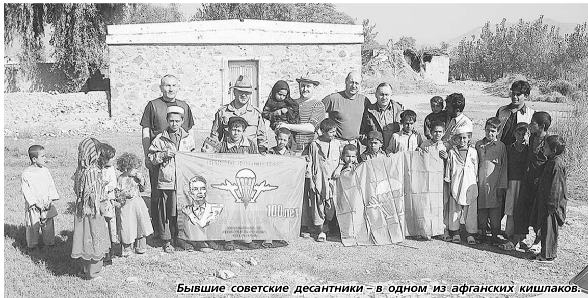
Бывшие советские десантники - в одном из афганских кишлаков.

нами» казарм спецназовцы отправлялись громить караваны с оружием и наркотиками. За 5 лет «караванной войны» советский спецназ уничтожил более 990 караванов.