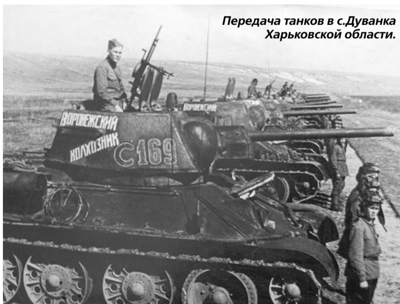
Передача танков в с.Дуванка Харьковской области.

Но все это – детали, которые не меняют главного. Как бы то ни было, танки, купленные на средства наших земляков, и люди, ведшие их в бой, вписали немало ярких строк в историю той войны. А значит, достойны того, чтобы через 70, 100 или 170 лет потомки вспоминали их с благодарностью, с преклонением перед величием народного подвига во имя Отечества.