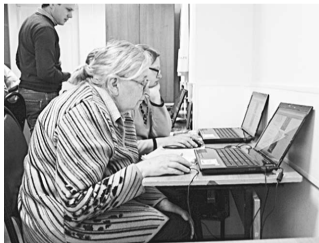
Пенсионеры – за компьютером.

Уже прошло три недели, как филиал Федеральной кадастровой палаты Росреестра по Воронежской области приступил к проведению мастер-классов по электронным услугам. Первое занятие состоялось в БУВО «Коминтерновский комплексный центр социального обслуживания населения «Радуга».