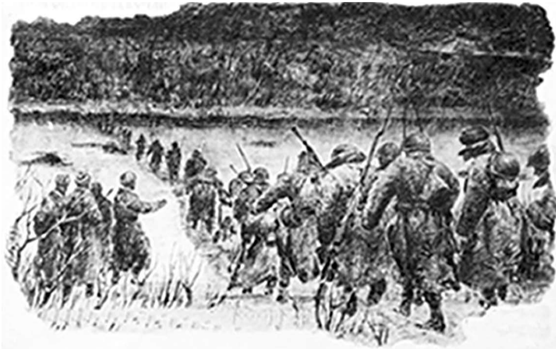
Переправа через Дон.

же я убить просто так, уже беспомощного, раненого врага! Я поднял шапку, нахлобучил на голову раненого и сказал ему, слегка подталкивая в плечо: «Медицина! Медицина!» И показал, что надо ползти к дороге. В глазах итальянца появилась теплота, будто признательность. Но он же враг! Что я должен делать? Я не убил его – пусть живет, может, подберут наши на дороге, в плену вылетят.