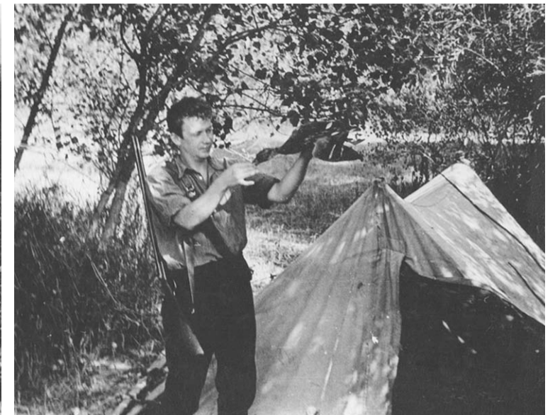
Автор этих строк готовится к охоте.

Обед чудесный, погода отличная, о нашем настроении и говорить нечего. Стало вечереть, и я решил еще выяснить возможный подход к болоту. Надел сапоги и двинулся. Почти сразу зачавкало под ногами, но еще кое-как шёл, преодолевая густой ольшаник. Скоро был вынужден обходить наиболее топкие места и неожиданно вышел на большую прогалину. С одной стороны – ольшаник, с другой – заросший камышом длин-