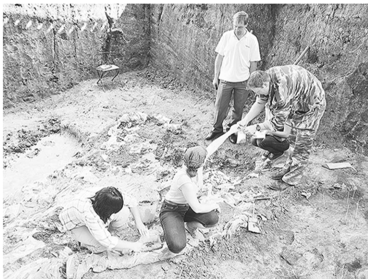
Проза будней археологов сопряжена с нелѳгким физическим трудом.

3. Открыты поселения эпохи поздней бронзы (1900-1300 гг. до н.э.). На них произведены исследования обнажений культурного слоя, а по результатам полевых исследований составлена детальная археологическая карта обследуемого микрорайона, включая археологические памятники, оказавшиеся в границах Еланского и Ёлкинского месторождений. Проведена вся необходимая камеральная обработка полученных археологических материалов: шифровка, прорисовка, фотоработы, графические и чертежные работы.