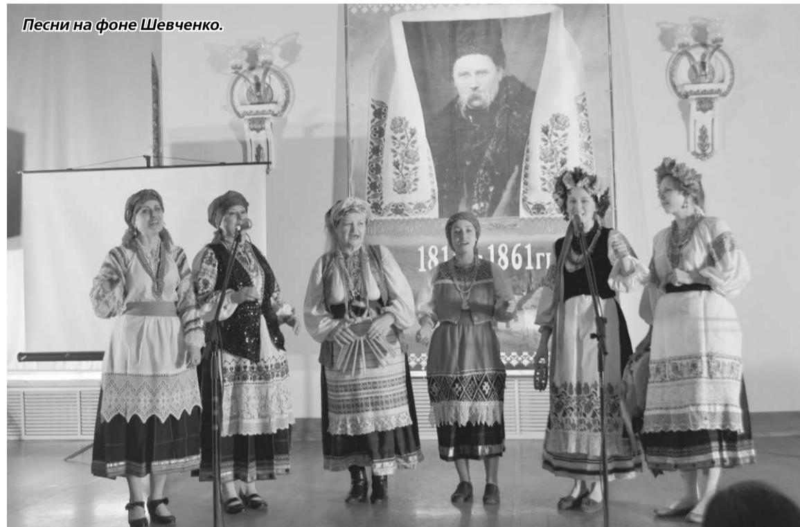
Песни на фоне Шевченко.