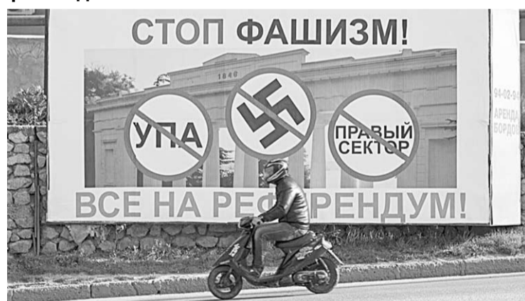
Такие транспаранты были в эти дни в Крыму.

На референдум 16 марта были вынесены два вопроса: «Вы за воссоединение Крыма с Россией на правах субъекта РФ?» и «Вы за восстановление действия Конституции Республики Крым 1992 года и за статус Крыма как части Украины?». Одобренным считается тот, за который проголосовало больше половины участников. По