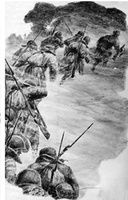
На новый рубеж.

винчиваясь, вонзился у пулемета – У-о-о-х! Ужас! Я отвернул голову... Накрыло, накрыло ребят! Нельзя же так! Учили же их маневру на поле боя! Эх! Жалко ребят! Ну и я хорош! Не мог собраться, сообразить! Видел же все, чувствовал беду, и... и не смог ничего сделать!