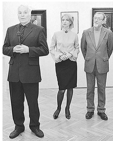
дар Воронежскому музею имени И.Н.Крамского.

Оба проекта подготовлены совместно с областным отделением Союза фотохудожников России.