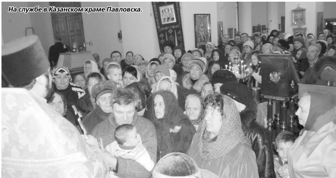
На службе в Казанском храме Павловска.