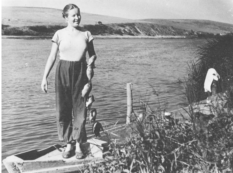
Вот так улов!

Время идет, и работа продвигается. Наконец разрешили охоту на