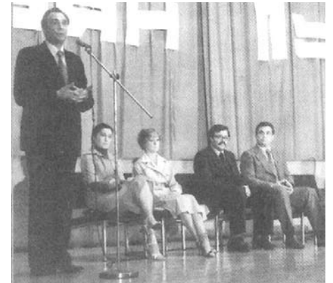
Евгений Матвеев на творческой встрече в кинотеатре «Пролетарий» (рядом В. Заклунная и Л. Гурченко).

Тяжёлые травмы, полученные на съёмках, приковывали Евгения Матвеева к постели несколько раз. Сложнейшие операции, корсеты и костыли сопровождали актёра долгое время, вынудив уйти из театра. Тогда он решил попробовать себя в кинорежиссуре. Талант Матвеева ярко проявился и здесь. Едва ли не все его фильмы были отмечены призами и зрительской любовью. Первой постановкой