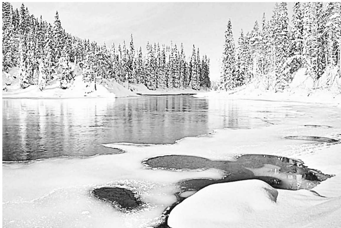
Синь небес и синь водной глади – это и есть Карелия.