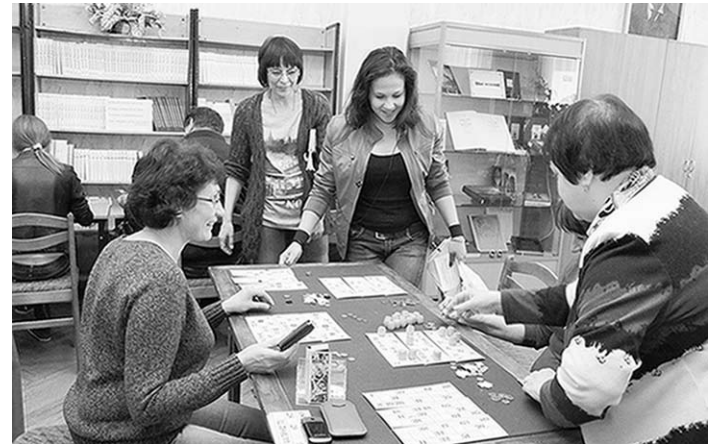
Можно было поиграть и в лото.

А сотрудники, например, библиотечного отдела редких и ценных книг подготовили программу «Что наша жизнь? Игра». Темой вечера и книжной выставки, как нетрудно догадаться, стала игра во всё её разнообразие. Была подготовлена презентация об истории карточных игр на Руси. В интерактивный же зал гости заглянули, чтобы совершить виртуальное путешествие по странам и континентам и крупнейшим городам мира в формате 3D.