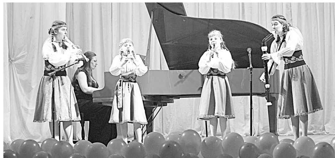
На творческом отчёте звучала самая разная музыка.