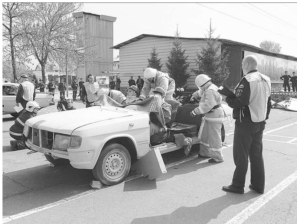
Один из моментов соревнований.

Воронежские спасатели вновь стали лучшими в Центральном федеральном округе