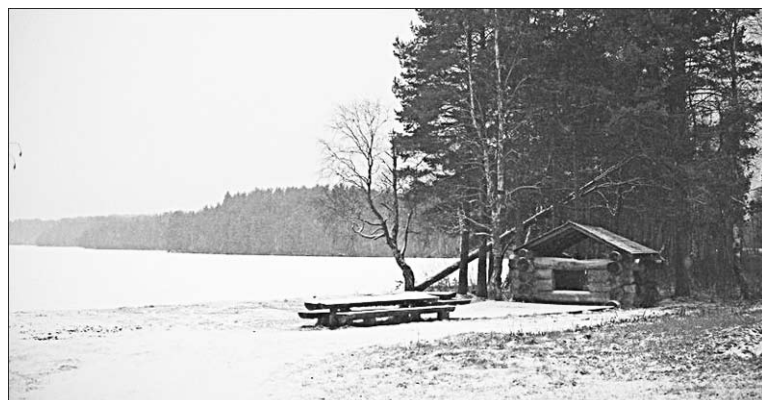
Тихая пристань - Карелия.