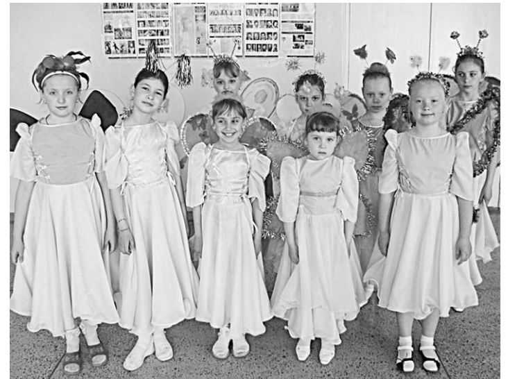
Свои таланты дети проявляют здесь очень рано.