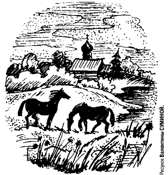
Рисунок Валентины СУМИНОЙ.

*** Что ты знаешь, скажи о возвышенной грусти, Об огромной душе, охладевшей, пустой, О старинной иконе над свечкой святой И о времени этом в облики монстра? Неужель ты не видишь, моё захоlustье,