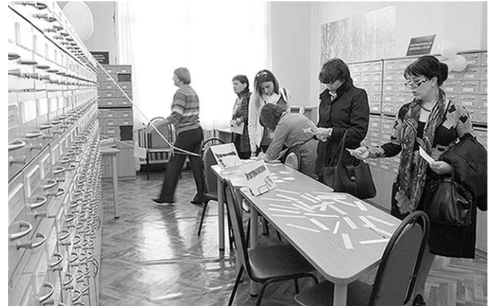
На всех этажах Никитинки бурлила жизнь.