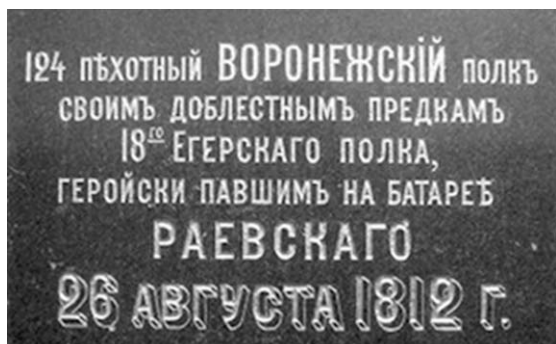
Мемориальная доска на обелиске.