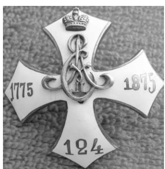
Знак 124-го пехотного Воронежского полка.