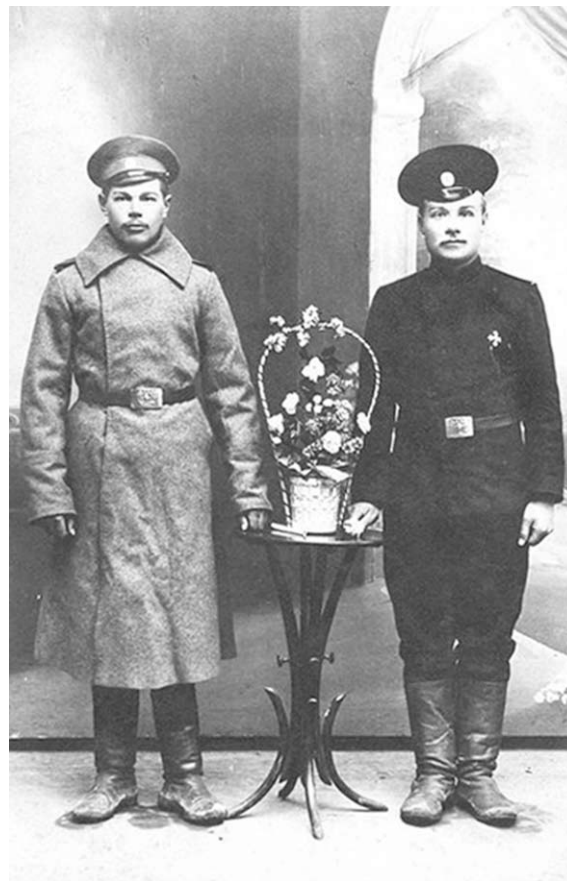
Нижние чины 124-го пехотного Воронежского полка. Б.А. Штейфон.

Весной 1918 года 124-й пехотный Воронежский полк постигла драматическая участь других полков Русской армии – он революционным образом «растаял». Полковой комитет 14 голосами из 40 принял (при меньшинстве!) «Воззвание о поддержке власти Советов». Нижние чины, выходцы с Украины (перед войной часть стояла в Харькове в составе 31-й пехотной дивизии 10-го армейского корпуса Киевского военного округа), откликнулись на призыв Рады и «украинизировались».