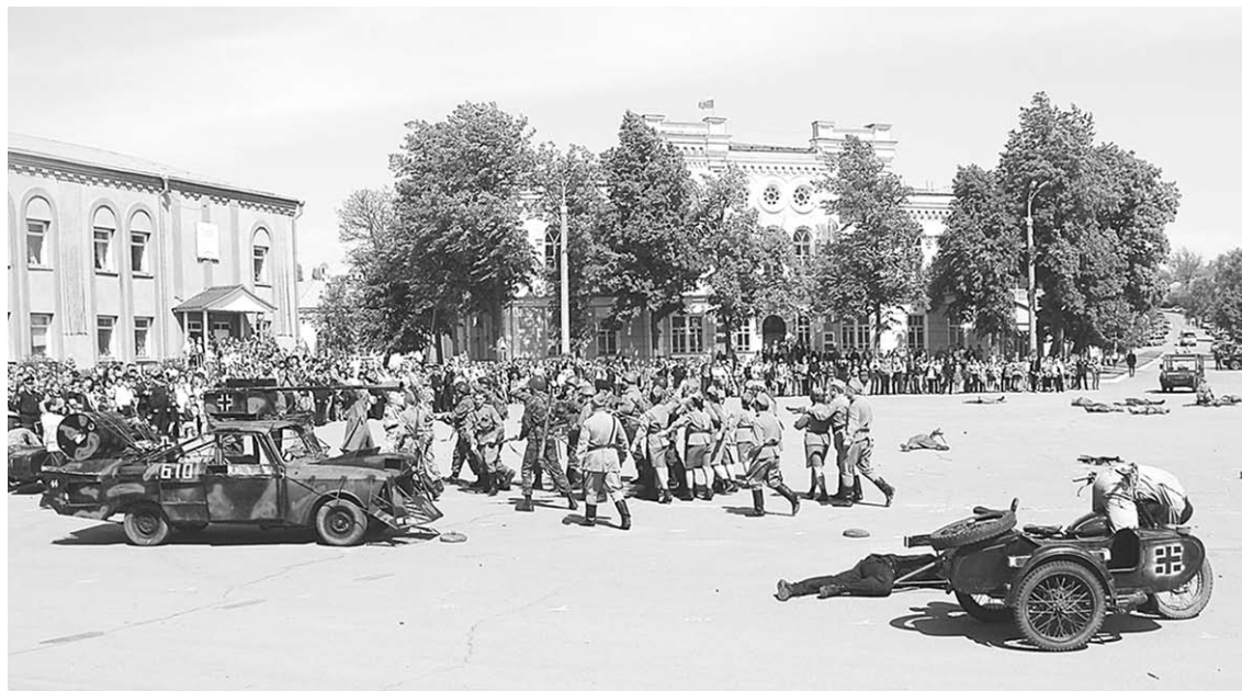
Так развивались события.

Наши солдаты под музыку песни «Вставай, страна огромная» поднимаются в атаку. Начинается бой! С северного и восточного направлений на площадь въезжают автомобили военных лет: знаменитая «полторка» и легковой автомобиль «Виллис». Артиллеристы под командованием Николая Бондарева выкатывают на позицию макет 45-миллиметрового орудия. Бой в самом разгаре: слышны звуки выстрелов, площадь в дыму от петард.