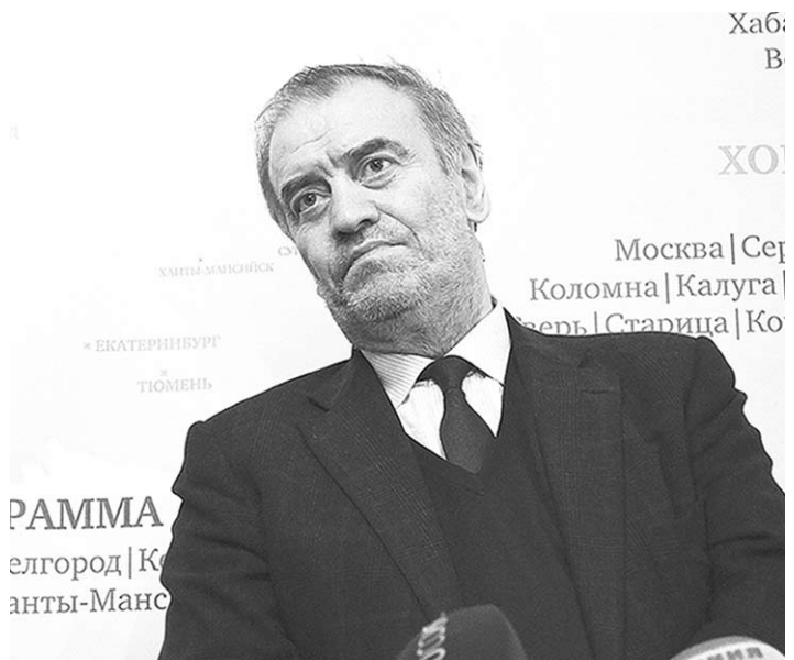
Маэстро Гергиев перед началом концерта.