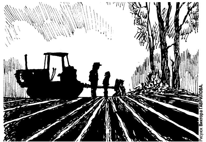
Рисунок Виктора ГАВРИЛОВА.

Смеркается. Туманы по низинам. Прощаемся холодным хмурым днём. Какое счастье в наших долгих зимах! О, только б жить, не думая о нём.