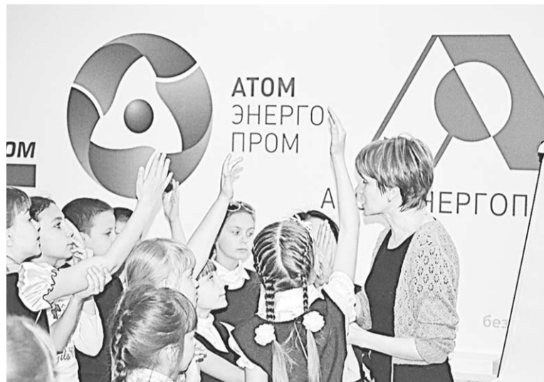
Обсуждения в Информцентре проходят бурно.