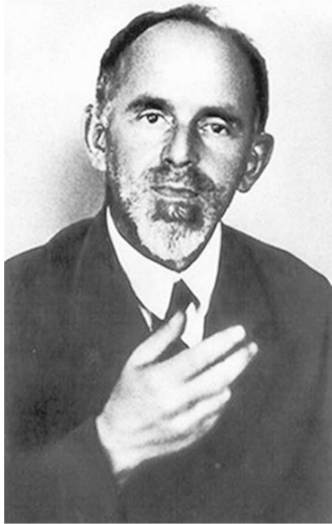
Осип Мандельштам, 1934 год.

Киев бурлил, перманентно митинговал и уже чувствовал себя «самостийным».