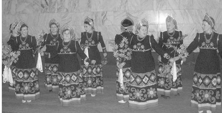
На сцене – ансамбль «Россияночка».