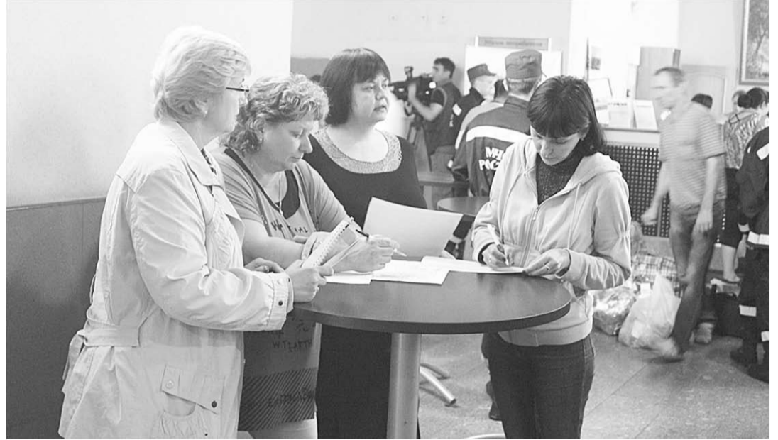
Беженцы проходят регистрацию.

В ночь на 22 июня в Воронеж из Ростовской области двумя самолётами ИЛ-76 МЧС России в международный аэропорт «Воронеж» доставлены 116 граждан из юго-восточных районов Украины, которые были вынуждены покинуть места своего постоянного проживания. Об этом сообщает пресс-центр правительства региона