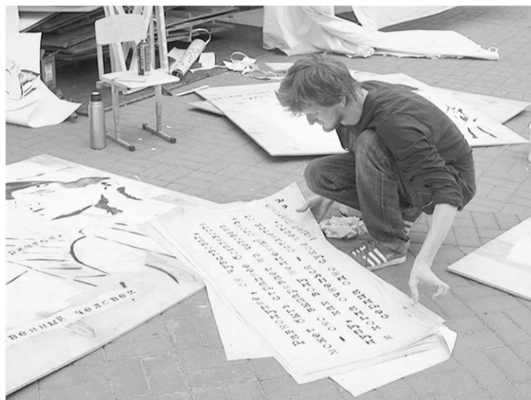
Создание арт-объектов на Советской площади.

В завершающий день мастер-классы, шоу-программы и лекции проходили в рамках «Пикника» параллельно – нужно было успеть до прихода на площадь уличных театров, которые шествовали по проспекту Революции. Открылась фотовыставка «Сушка»: это международная акция по обмену фотографиями, придуманная в Санкт-Петербурге в 2010 году. С тех пор она охватила более 40 городов России. Правила «Сушки» просты – ты оставляешь свою работу и забираешь в обмен другую. На обратной стороне фотокарточки желательнее оставить коор-