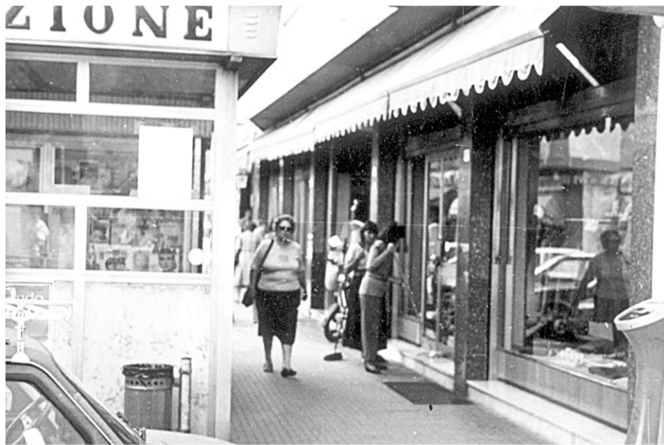
Вот такими я видел тогда улицы и улочки итальянских городов.

изводить такие звуки, которые мог издавать только отбойный молоток, вгрызающийся в бетон, — очевидно, из соображений все той же экономии под капот этого монстра «поселили» двигатель от старенькой молотилки и теперь о всех наших передвижениях знали даже в Воронеже.