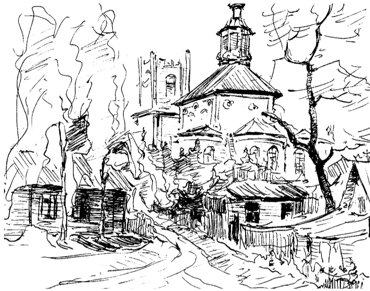
Рисунки Анастасии МАЗУХИ.

*** В час печали, в день разлуки, в миг прощания Не спеши забыть свои обещания. Ведь помимо нашей воли, даже разума, Память рук и память губ нам предсказана. Эта память так коварна, злая хищница, Будто нет её, да вдруг и отыщется, Подкрадётся, словно тень незаметная, Возвратит тебя в тот день время светлое. Не простит, не пощадит ночь-бессонница,