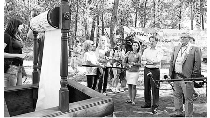
Алексей Гордеев на молодёжном форуме.

Знакомство же с работой форума Алексей Гордеев начал с площадки «Молодёжное самоуправление». Здесь глава региона встретился с представителями общественной организации «Землячество «Воронежцы» в Москве. Они рассказали, что молодёжный совет объединяет студентов столичных вузов, которые родом из Воронежской области, и организует свою деятельность по пяти направлениям: общественное, спортивное, образовательное, информационное, добровольческое. Ребята активно занимаются общественной работой, интересуются научной деятельностью, устраивают дружеские межгородские турниры по футболу и теннису.