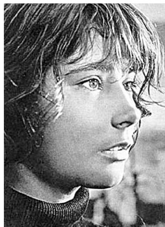
Татьяна Самойлова в фильме «Летят журавли».