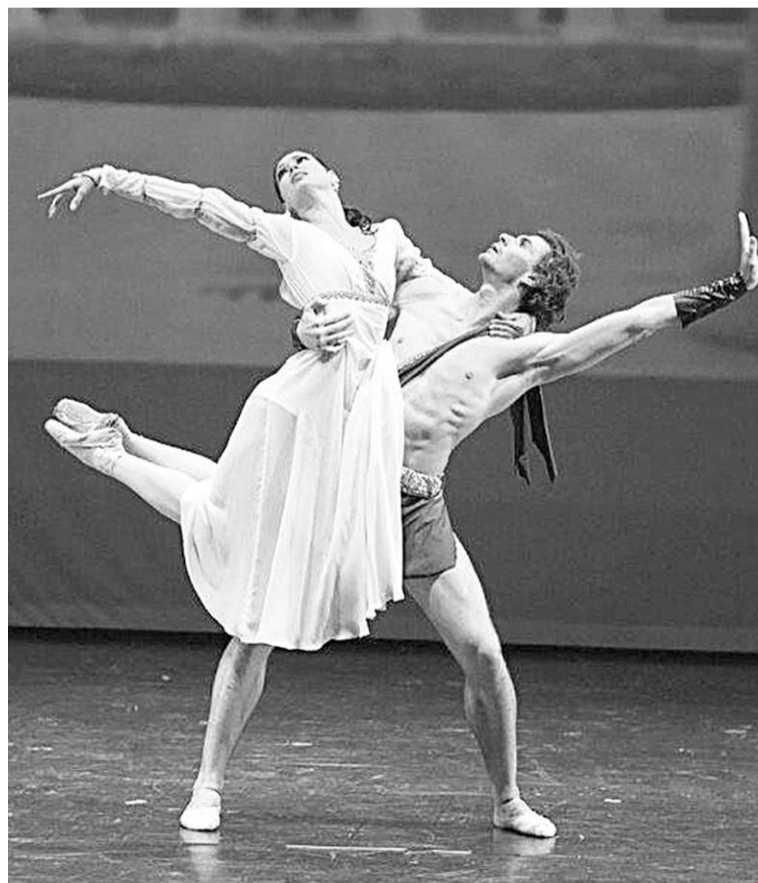
Нашим танцорам есть чем поразить публику за рубежом.

Артисты Воронежского театра оперы и балета покорили танцем публику в Греции и Италии