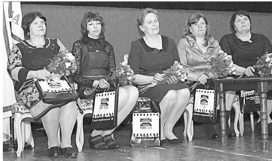
Мамы из смоленского села Шапы.

Дедушка, местный житель, на экране ворчит: «Тут внука на неделю привезут, мороки не оберёшься, голова кругом. Так у нас один!.. А