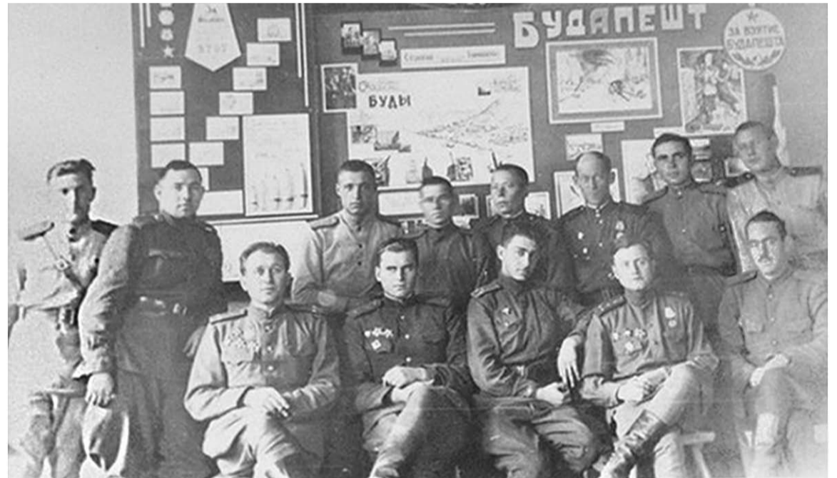
С участниками былых сражений.

В Воронеже окончил энергетический техникум, а затем педагогический институт. Работал военруком в средней школе №12, учителем математики в школе №13, директором школы. В 1995 году в честь сорокалетия Победы награжден третьим орденом Отечественной войны за многолетнюю и самоотверженную работу по военно-патриотическому воспитанию молодежи, активное участие в работе Совета ветеранов, пропаганду боевых традиций.