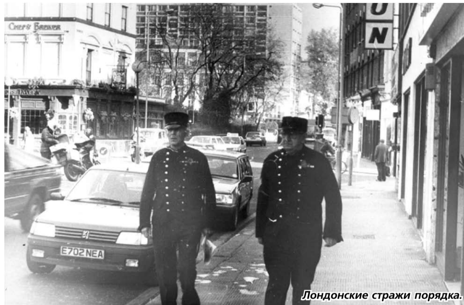
Лондонские стражи порядка.

— Ладно, не буду вас больше интриговать, — сказал я, опасаясь, что они могут повредиться раньше, чем узнают мое Отечество, — я из Советского Союза.