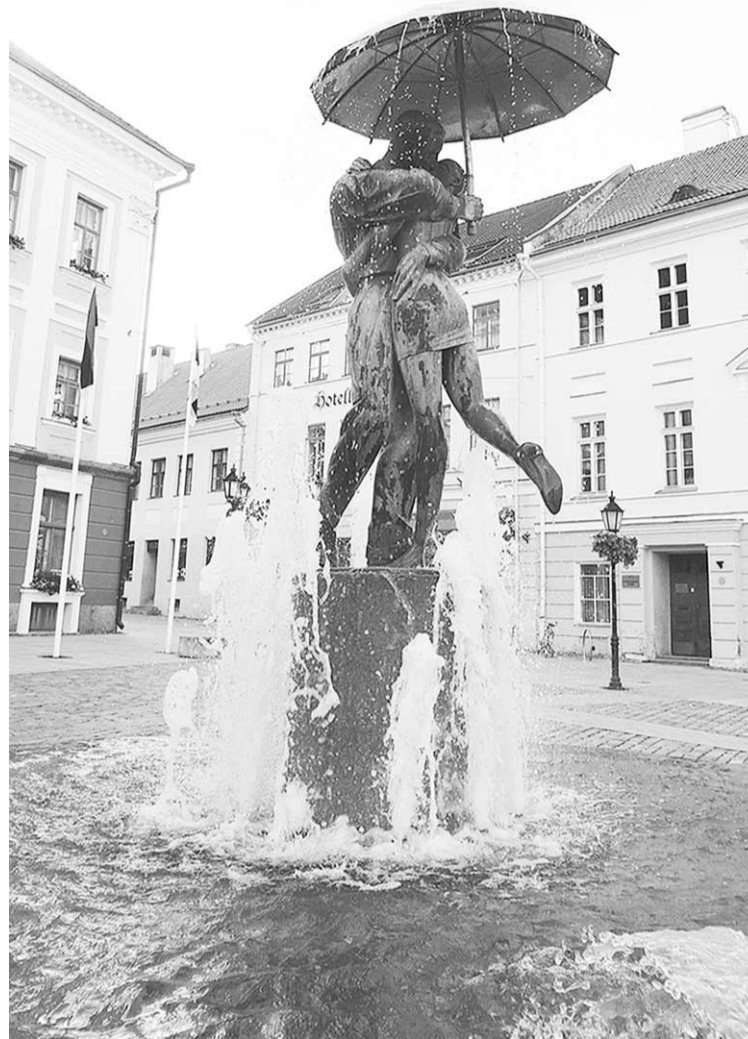
Символ города – фонтан «Целующиеся студенты».

Эстония – страна с небольшим населением. Всего в ней чуть более миллиона жителей, почти как в Воронеже. Она заселена только местами,