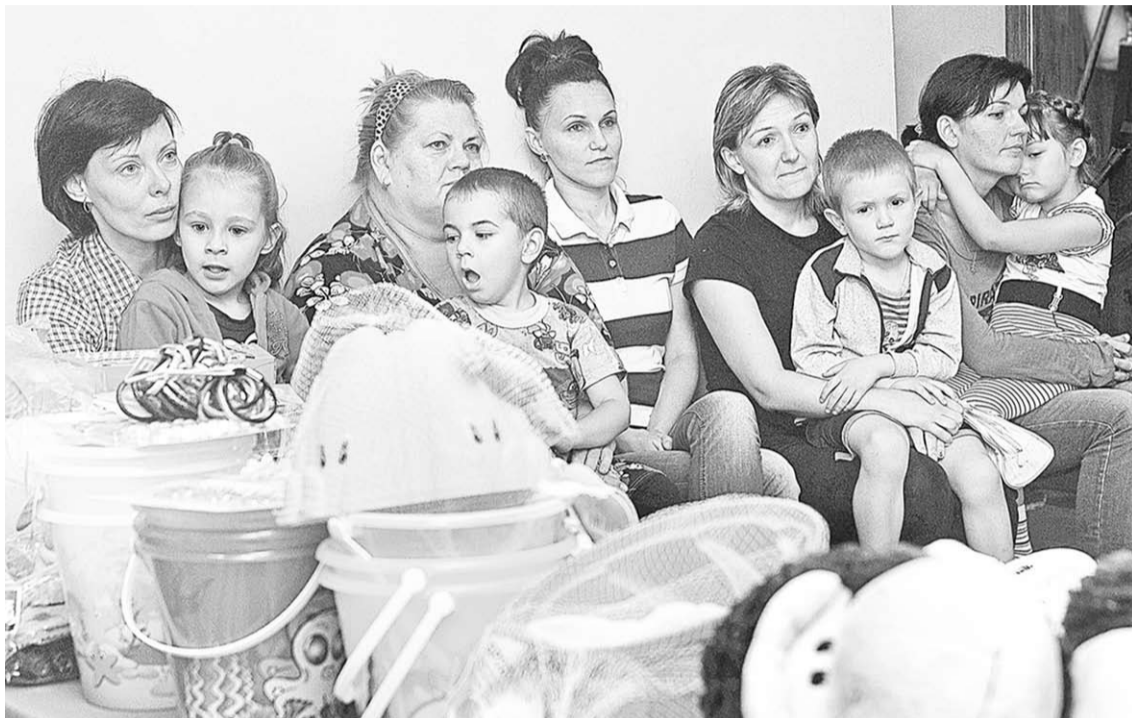
Вот они, беженцы с Украины. Их приютила Россия, воронежский край.

Я рада, что России не удалось «расшатать» Харьков, Днепр, Одессу, Херсон и Николаев. А попытки были серьёзные».