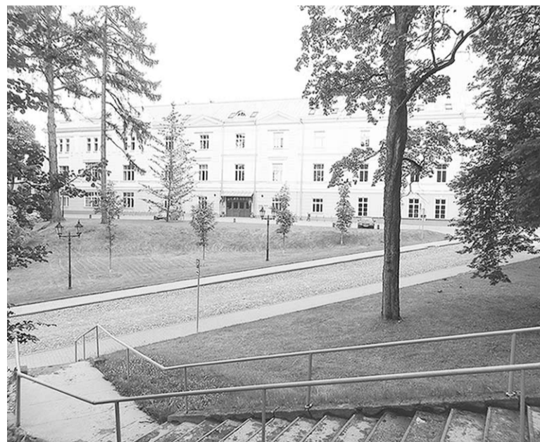
Учебный корпус факультета социальных наук.

Семестр в Тартуском университете пролетел незаметно. Мучения обучения всегда заканчиваются за три месяца, а опыт жизни в другой стране и приятные впечатления остаются навсегда.