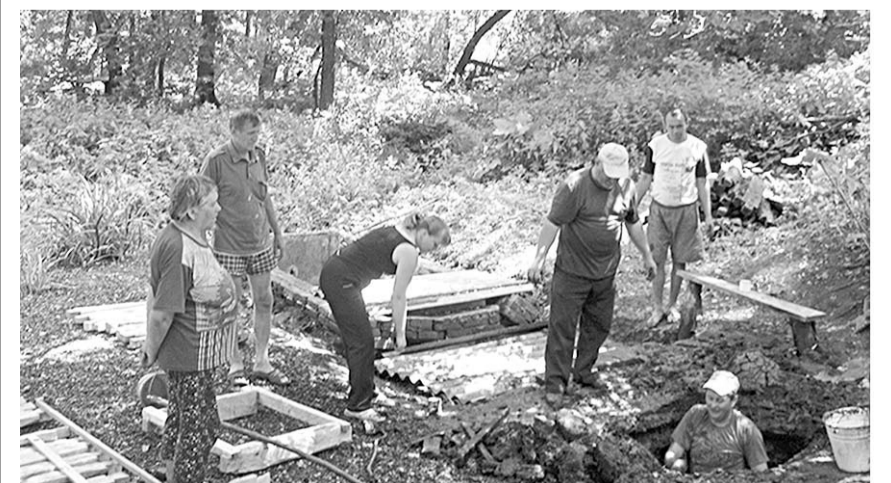
Кипит работа у источника.

Мои земляки – люди инициативные, трудолюбивые, неравнодушные, сами переломить ситуацию не могут. Нужна разумная политика по трудовой занятости населения и созданию рабочих мест.