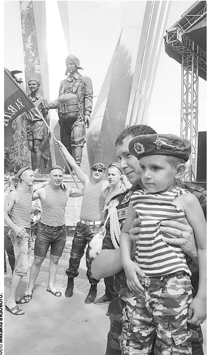
Воронежские десантники растят новое поколение защитников Родины.

Дети, участвующие на празднике в конкурсах, в качестве приза получили билеты на аттракционы, находящиеся тут же, у ТРЦ «Арена». Исключением стали водные аттракционы. Они, как и городские фонтаны, были на всякий случай отключены.