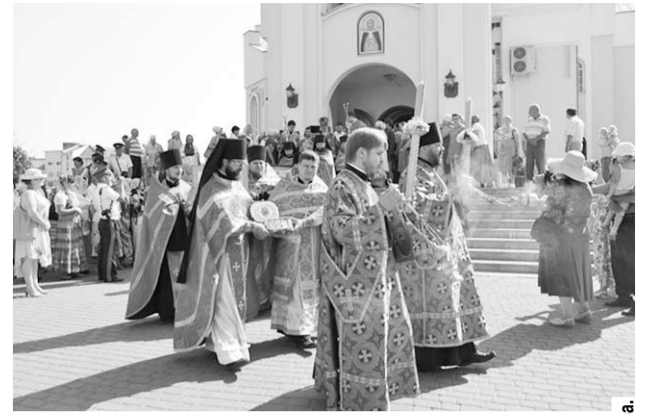
Во время крестного хода.

В этот же день на территории храмового комплекса была развернута выставка тематических подворий из нескольких районов Воронежской области. В затейливо украшенных крестьянских хатах можно было увидеть позабытые ныне предметы обихода: мельницу, прялку, самовар — яркие и содержательные экспозиции иллюстрировали жизнь наших предков и поражали красочностью и затейливостью. Пройдясь по экспозициям, и