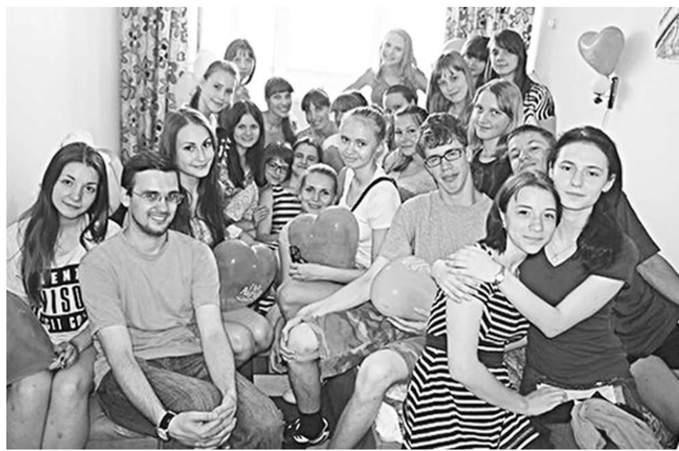
Весь наш лагерный сбор.

Каждый вечер мы подводили итоги дня, а потом каждый мог выступить с новыми предложениями и идеями. Наш отряд подготовил три видеоклипа, которые отразили жизнь в лагере.