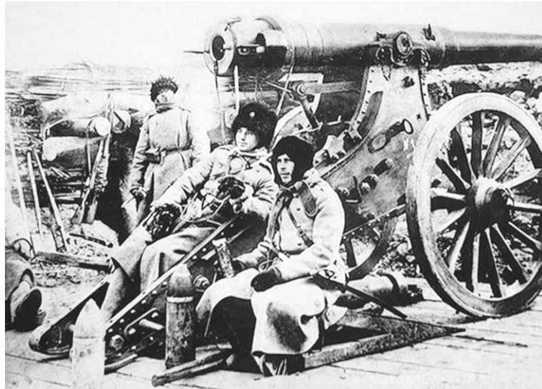
На передовой позиции.

Распоряжения военного руководства, нелогичные и непоследовательные, выматывали силы солдат и офи-