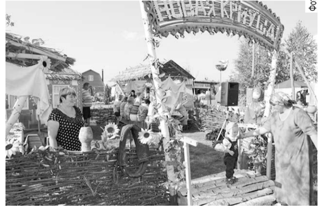
На подворье села Новая Криуша.

гости, и сами росошанцы могли познакомиться с казачьими традициями и фольклором и воочию убедиться, насколько воронежская земля народными умельцами богата. И к тому же в каждом подворье всех желающих щедро угощали традиционными блюдами русской кухни, пели песни и частушки.