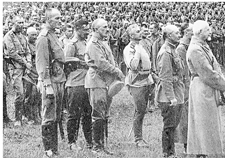
Молебен перед наступлением в полках 37-й пехотной дивизии. Карпаты, лето 1916г.

Первая его редакция, завершённая в 1970 году и опубликованная на Западе в 1971 году, вызвала бурное возмущение в советской прессе. Роман (в ту пору мало кем прочитанный) был безоговорочно осуждён, а сам писатель, через три года ставший самым известным советским изгнанником, продолжил работу с использованием ранее ему недоступных западных архивов. В результате «Август Четырнадцатого», разросшийся до двух томов, был в таком виде полностью издан в США в 1983 году. А через семь лет пришёл уже и к советскому читателю.