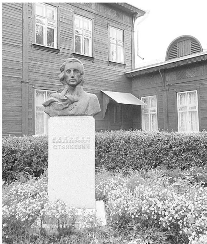
Памятник Николаю Станкевичу в Мухомудерке Белгородской области.

Этот урок более чем полезен в наше время, когда Россия вновь становится для себя проблемой, когда ведется поиск путей развития нашей страны и форм общения с соседними государствами и народами.