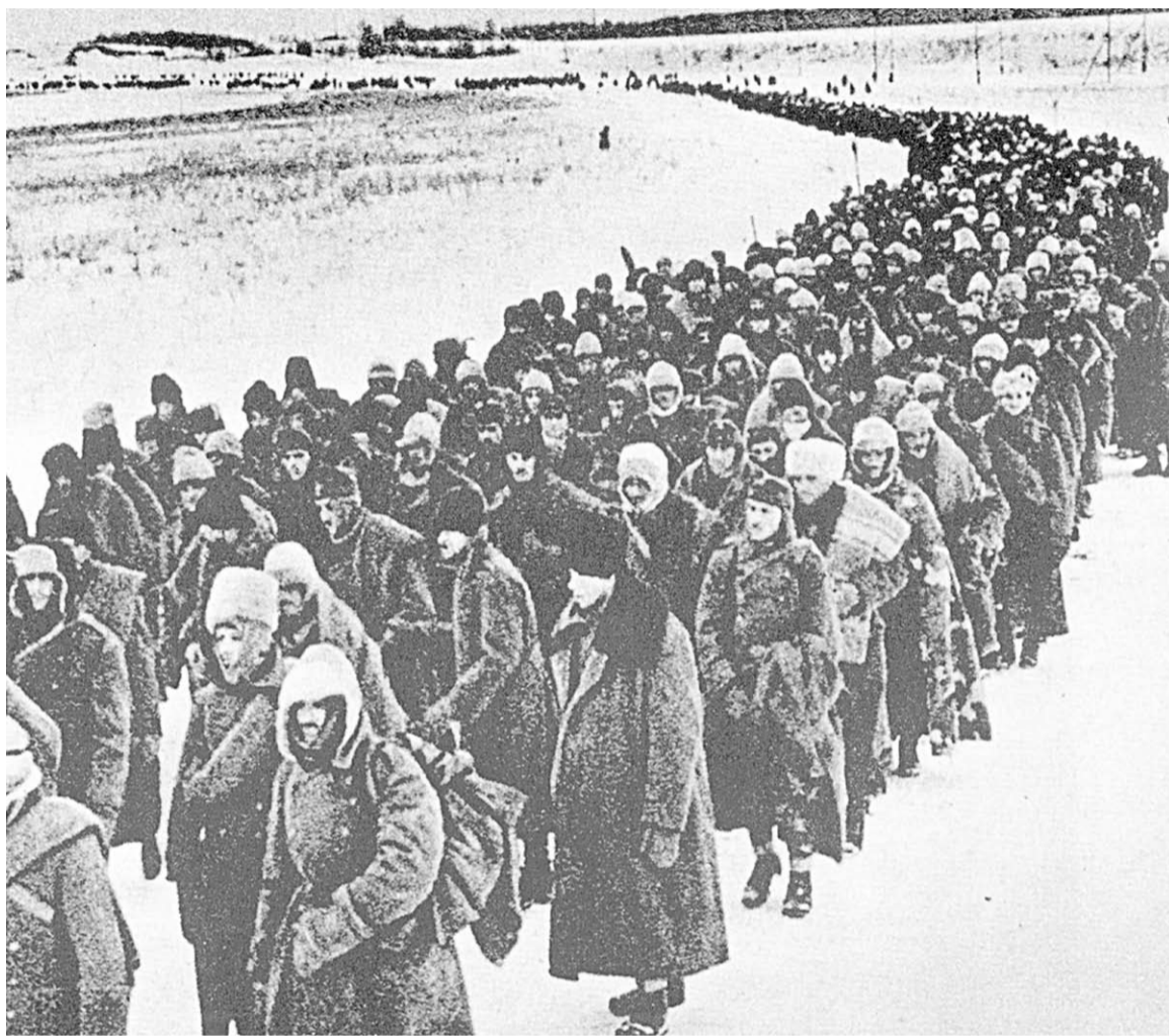
Колонна итальянских пленных на Дону.

С уважением к вам и вашим учителям, Афанасий Артемьевич».