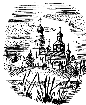
Рисунок Валентины СУМКИНОЙ.

Дано ей в безвременьи выжить, Судьбы не марая в крови. Провинция к совести ближе, Провинция ближе к любви.