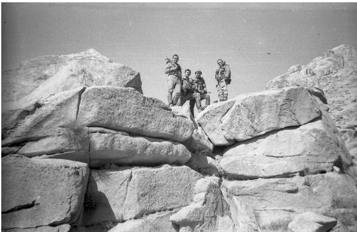
А это уже на боевой операции в горах Искаполя. Январь 1986 года.

В подмосковной учебке на полигоне курсанты несколько раз стреляли из автомата, метали гранаты. Помню, я подошел к барьеру, командир взвода подает гранату и запал. Вкручивая запал и чувствую, что мне становится не по себе. Не слушаются руки, пот выступил на лбу. Пронеслась шальная мысль: отдать гранату и бежать куда глаза глядят. Страх был настолько осязаемый, что я его чувствовал каждой клеточкой тела. Оглянулся назад, где стояли ребята и ждали своей очереди на метание.