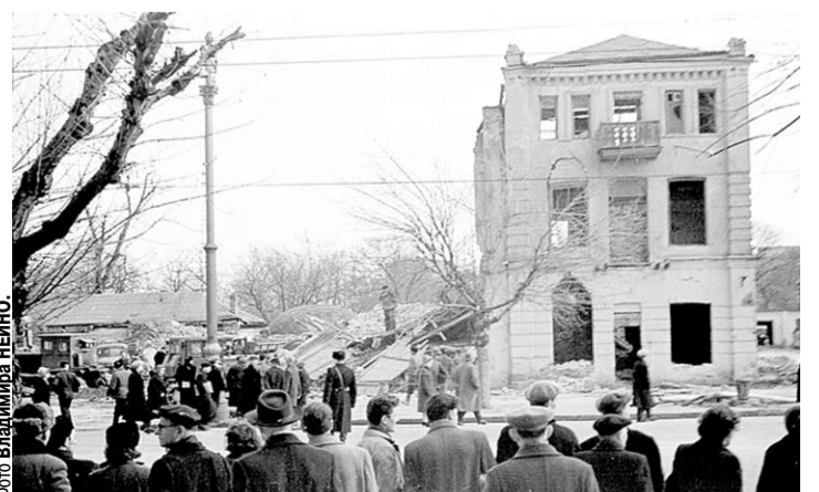
«Расширение улицы 9 Января, 1962 год».

Фестиваль аналоговой фотографии состоится в нескольких точках города. Это вклад воронежских фотомастеров в Год культуры, который отмечается в нынешнем году.