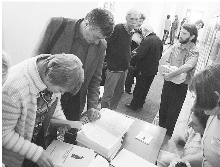
Пришедшие на презентацию с интересом листали Книгу Памяти.

Неоценимую роль сыграл в создании базы воронежский исто-