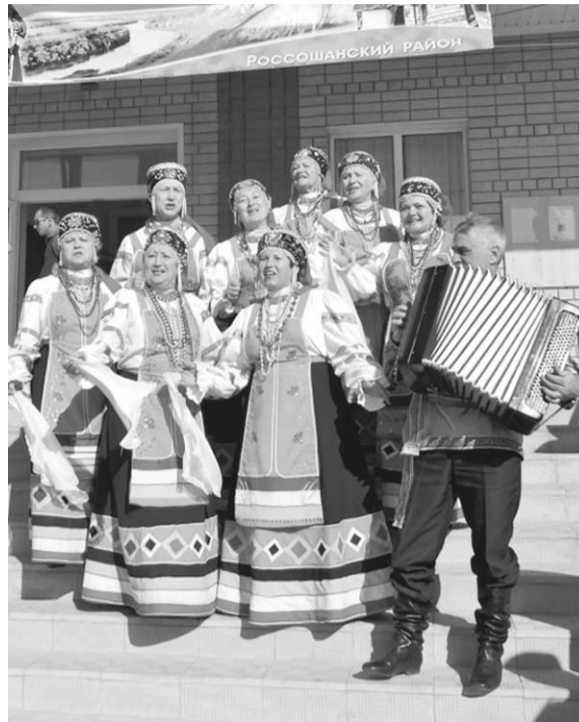
Звучали на празднике и раздольные напевы, и скоморохи веселили народ.

Открывал концертную программу народный хор «Дончаночка». В Новой Калитве этот коллектив из соседнего села всегда принимают очень тепло. Вообще, на мой взгляд, такие вот праздники в сельских клубах и домах культуры отличаются особой душевностью. И в зале все друг друга знают, и на сцене столько узнаваемых лиц. С тем работают вместе, тот сосед или вовсе родня. Все свои. Но ведь как играют, как поют! Именно они, самодеятельные артисты, приехавшие сюда из всех сёл района, и есть истинно народные, независимо от того, присвоено им официально звание «народный» или нет.