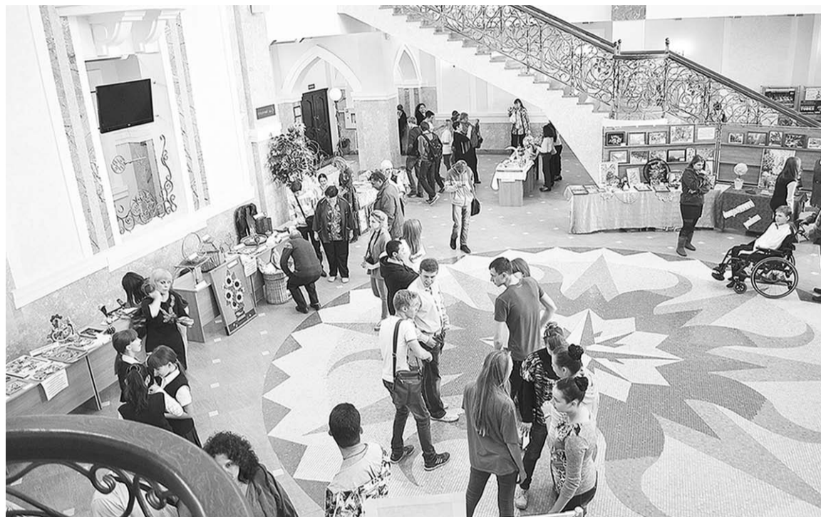
Фойе Дворца молодёжи стало своеобразным выставочным залом.

Ну, а затем наступила пора главного события фестиваля – гала-концерта, который порадовал зрителей обилием разнообразных номеров. Были здесь и сольные