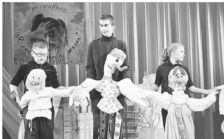
На сцене – артисты театральной студии «Арлекин».

Ну, а завершился фестиваль награждением всех его участников, которые едва уместились на сцене. Не исключено, что в будущем году их станет еще больше, поскольку организаторы намереваются пригласить на него молодых исполнителей из других областей Черноземья. Но так ведь и должно быть – хорошее дело необходимо развивать и ширить, а возможности и главное желание для этого у устроителей фестиваля есть.