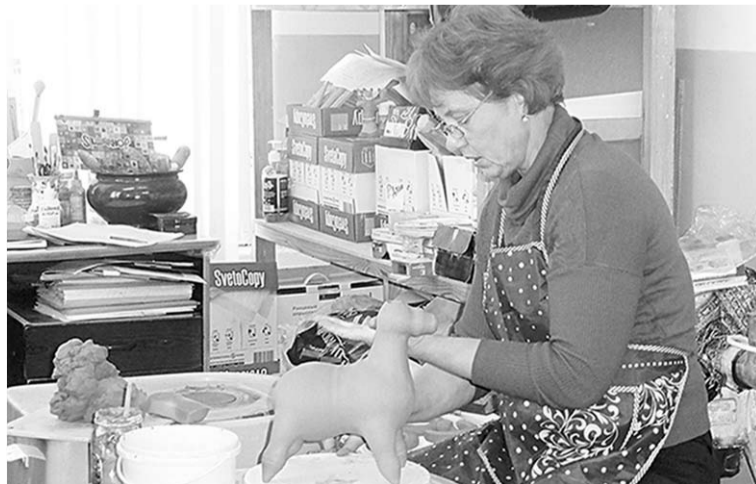
Так рождается игрушка.

На выставке «На круги своя...» воронежские мастера достойно представили гончарный промысел, продемонстрировав лучшие образцы собственного творчества – карачунскую и авторскую глиняную игрушки: свистульки в виде животных, звенящие колокольчики, карусели, подсвечники, кувшинчики на подвесках, поющих баб в традиционных костюмах сёл Воронежской области. Вот так наши земляки продолжают гончарные традиции, внося в них свои «изюминки».