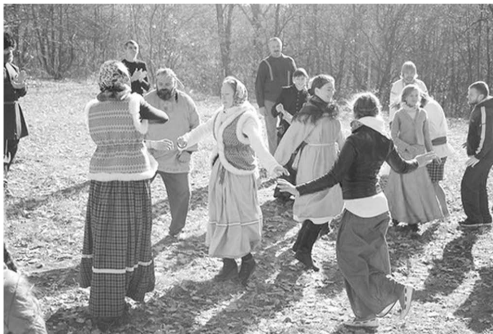
Ни одна «Вечёрка» не обходится без лирических хоромов и слов признания.

Коллектив «вечёрошников» ставит перед собой две цели: во-первых, объединить людей, которые интересуются русскими традициями, а во-вторых, наглядно рассказать о них тем, кто ничего об этом не знает. По словам организаторов, на «Вечёрки» приходит очень мало «знающих» людей, но есть и такие, кто время от времени даже ездит в этнографические экспедиции.