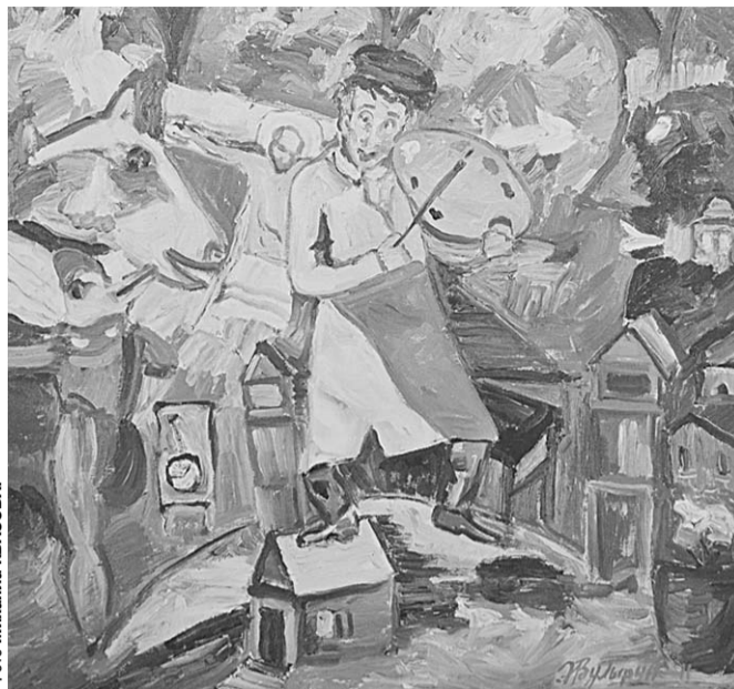
Эмиль Вульфин. «К воспоминаниям Шагала».

В церемонии открытия выставки приняли участие представители посольства Государства Израиль в Российской Федерации. Впечатления о Воронеже у них — самые тёплые.