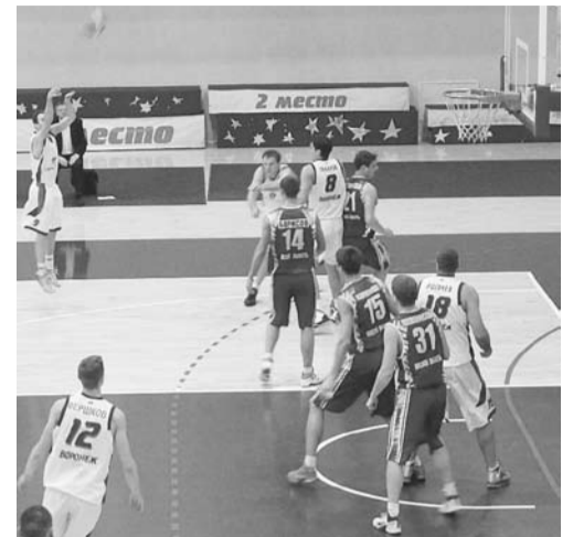
Момент встречи команд «Согдиана-СКИФ» и БК1716.