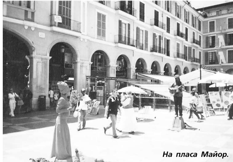
На пласа Майор.

Сеу» – великолепный кафедральный собор в столице острова – Пальме, построенный в каталонском стиле в XIII – XVII веках и по площади и высоте сводов уступающий лишь своему знаменитому собрату в Милане. Собор этот известен не только самым большим в мире витражом и богатым убранством, в оформлении которого участвовал даже великий Антонио Гауди, но и великолепным старинным органом, под аккомпанемент которого произведения Баха и Генделя в исполнении местных музыкантов звучат как-то особенно торжественно и проникновенно.