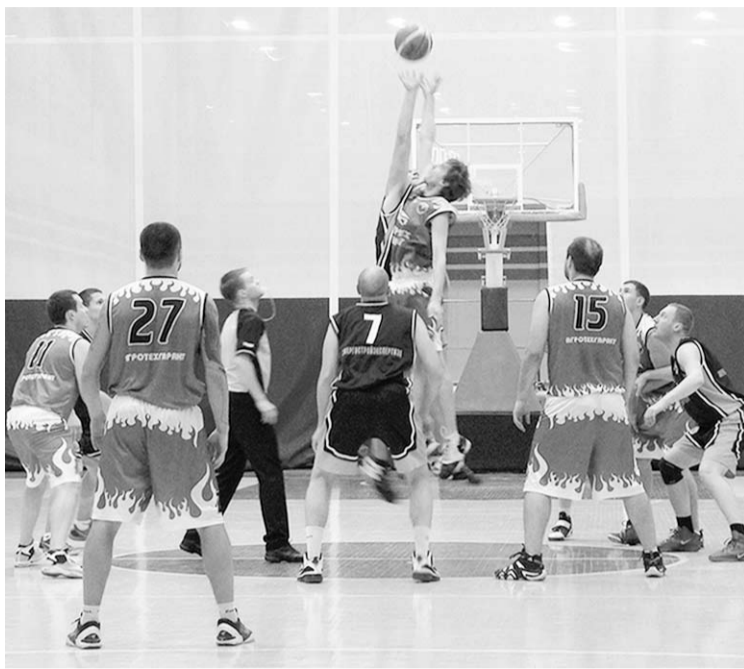
Начало встречи между командами «Агротехгарант» - «Атом».

Баскетбольные любительские команды продолжили спор 1 и 2 ноября