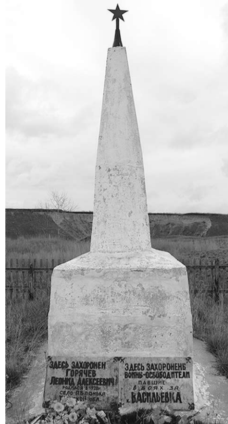
Памятник на могиле.

За этот подвиг командиры и механики-водители были представлены к званию Героя Советского Союза. Но награждены посмертно лишь орденами Отечественной войны I степени. Другие члены экипажа к наградам не