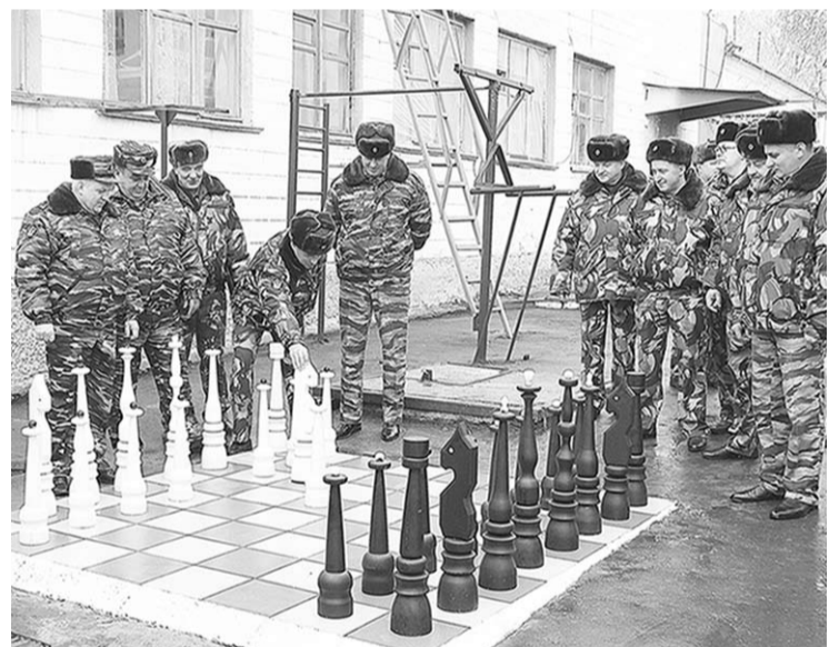
В минуты отдыха можно и в шахматы сразиться.

Затронули на коллегии и другую, не менее важную тему – мероприятия по социальной реабилитации осужденных. Как было отмечено, в каждом ИК оборудованы отряды с улучшенными материально-бытовыми условиями. Организовано конструктивное сотрудничество с различными институтами гражданского общества в сфере соблюдения прав и законных интересов осужденных. В том числе и с аппаратом Уполномоченного по правам человека в Воронежской области и общественной наблюдательной комиссией региона. В исправительных колониях установлены электронные терминалы с правовой информацией, сведения об имеющихся вакансиях на рынке труда, начислениях денежных средств на лицевые счета осужденных и удержания с них и многое другое.