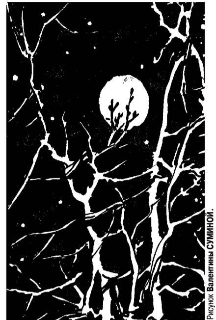
Рисунок Валентины СУМИНОЙ.

Озими нежной до самой весны Будут навеяны тёплые сны.