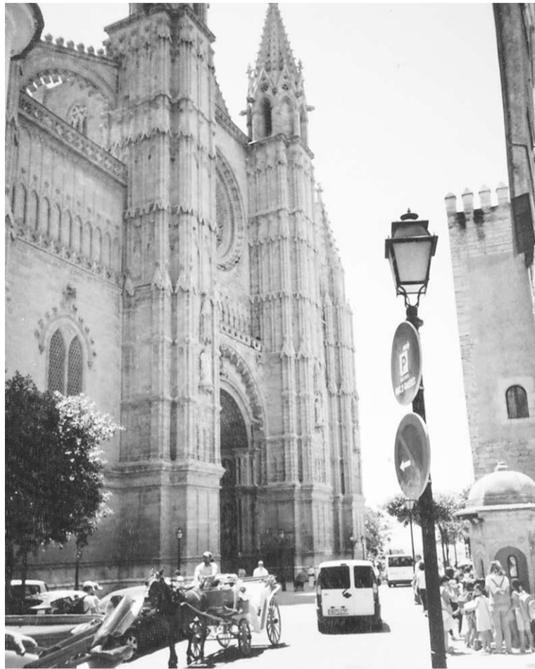
У главного входа в Ла Сеу.