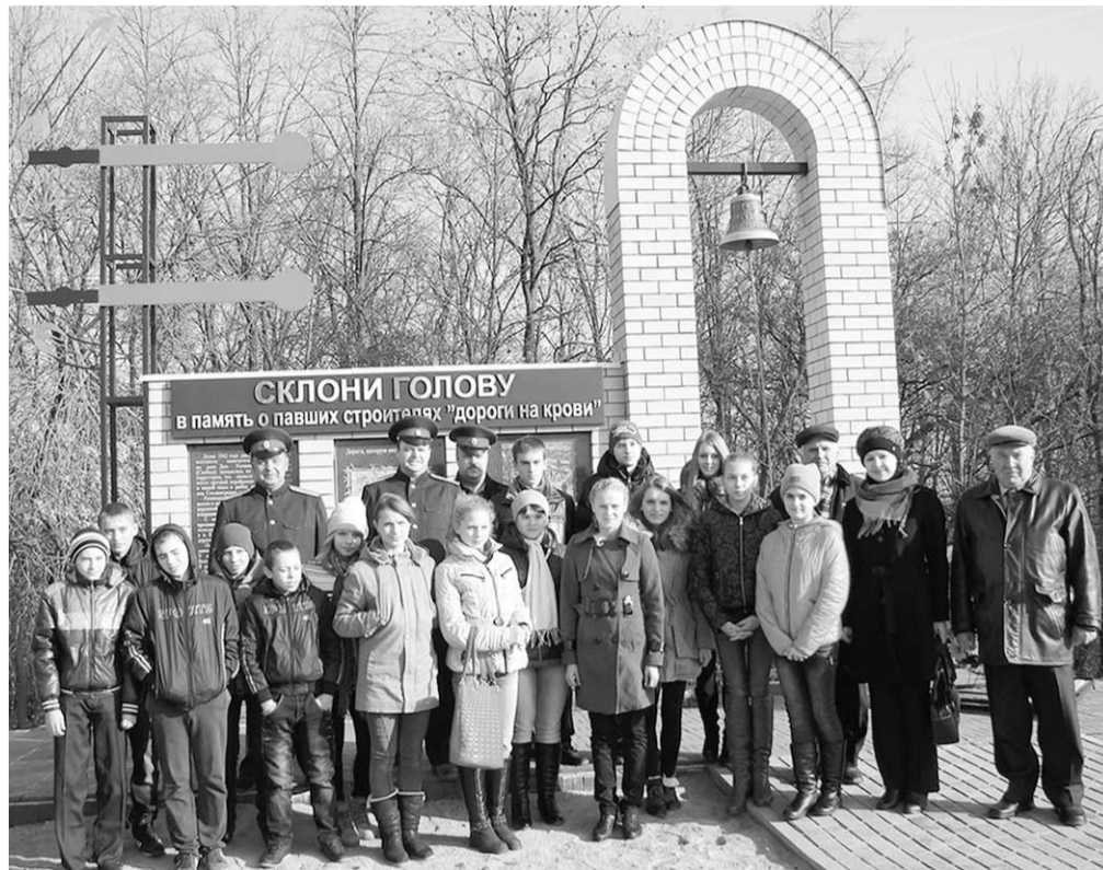
Ребята и педагоги сфотографировались у памятного знака.