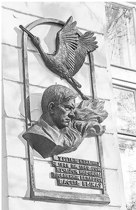
Мемориальная доска народному писателю Василию Быкову.