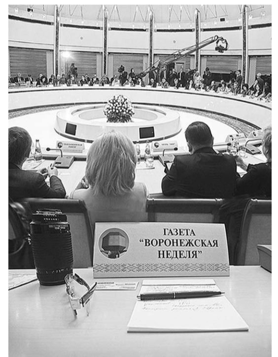
Во время пресс-конференции.