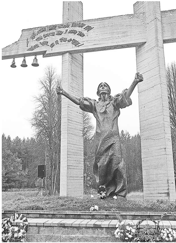
В память о погибших в Великую Отечественную.