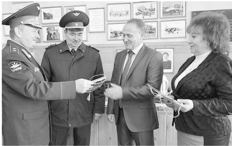
В школьном музее гости из Военно-воздушной академии.