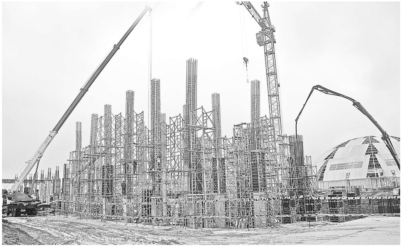
Республика растёт и строится.