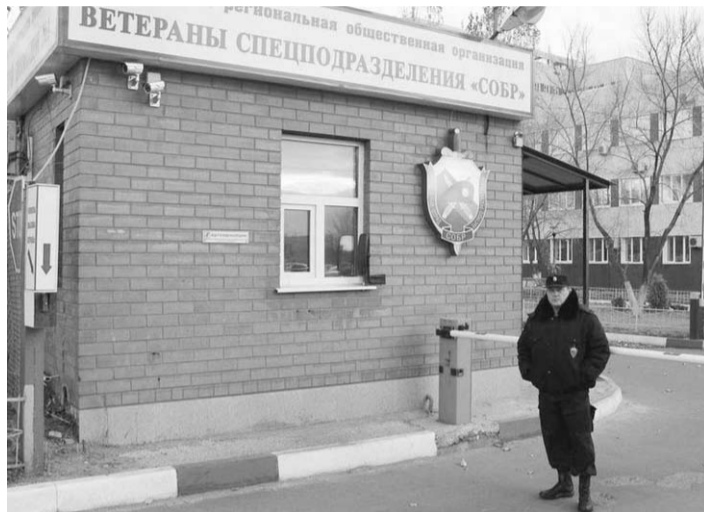
Отлично обученные крепкие охранники справятся с любой ситуацией нарушения порядка даже в самых экстремальных условиях.

За год с небольшим работы у охранной группы хорошие результаты: если на территории больницы и совершаются единичные противоправные деяния, с помощью ветеранов СОБР они тут же раскрываются.