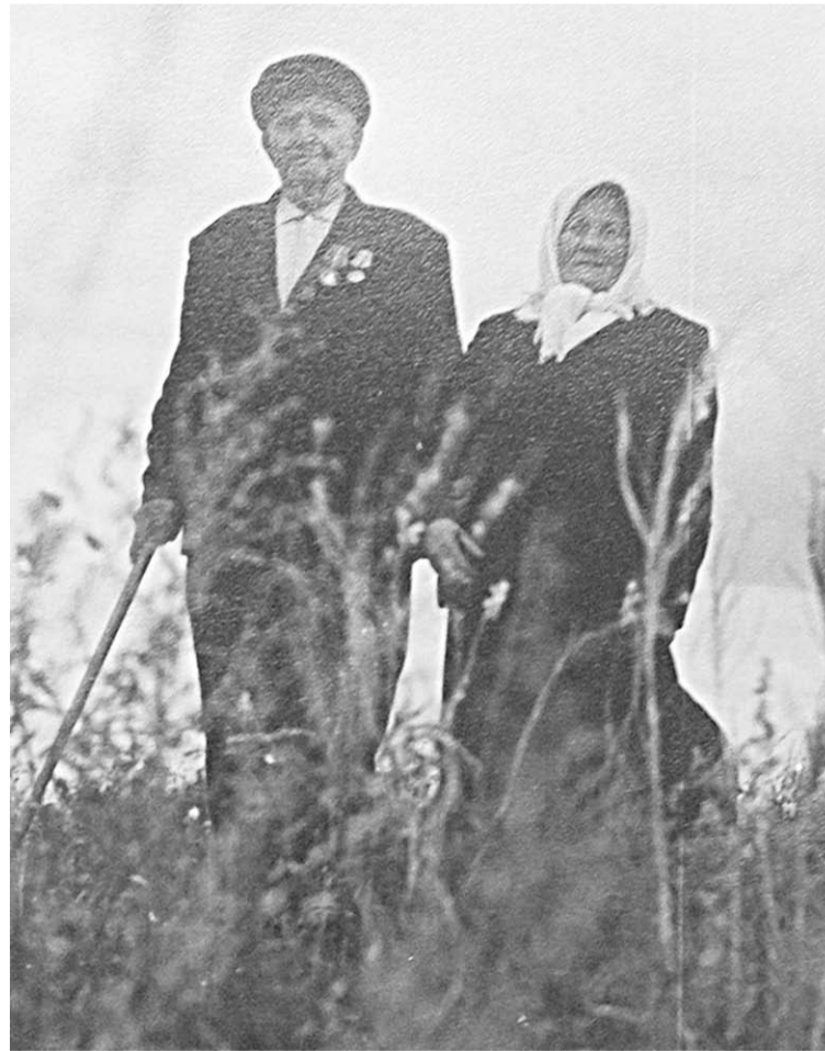
Отец и мать героя. 1967 год.