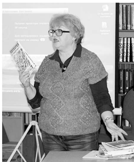
Всегда есть чем поделиться, что рассказать.

На сегодняшний день в библиотеке им. С.Я.Маршака работают 13 человек. Каждый из них имеет опыт организации проведения мастер-классов.