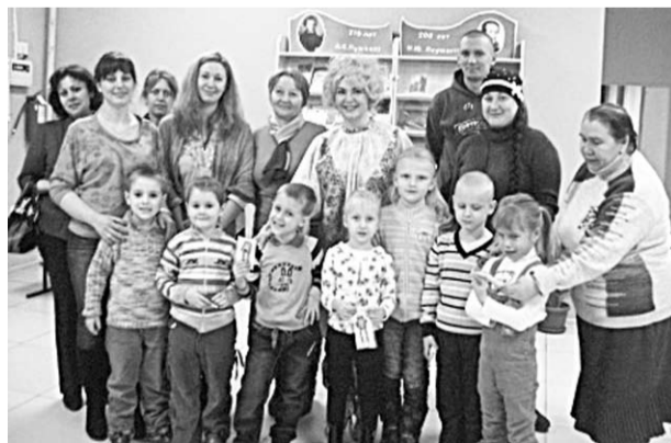
Ценные уроки получили и дети, и взрослые.

Вот и встретившая юных и уже взрослых гостей хозяйка представления, рыжая девочка по имени Кнопочка, сама когда-то была очень невоспитанной. Однако,