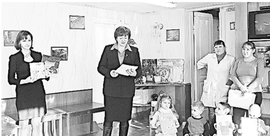
Почтовые работники в гости у дошколят.

Акция «Мама, я тебя люблю!» прошла и в Воронежской области. Сотрудники ОСП Россошанский почтамт, например, посетили детский сад №64. Воспитанники от 4 до 6 лет изготовили 29 аппликаций и сделали более 20 рисунков. Мамы ребят получили эти послания по почте к