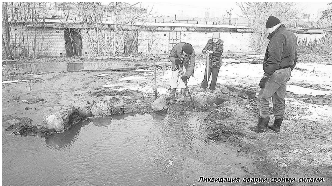
Ликвидация аварии своими силами.

P.S. Течь ликвидировали только в понедельник, ближе к полудню. И, наконец, место прорыва, где я едва не утонул, было обозначено ленточками.