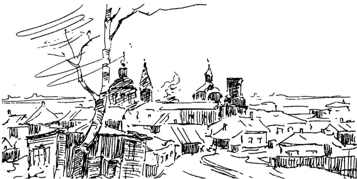
Рисунок Анатолия МАЗУХИ.

*** Прошуршит осенняя осока: Все до срока в мире, Все – до срока. И об этом чётко В светлых кронах Прокричит мне Местная ворона. В берег приунывшего пруда Горьким вздохом Плещется вода.