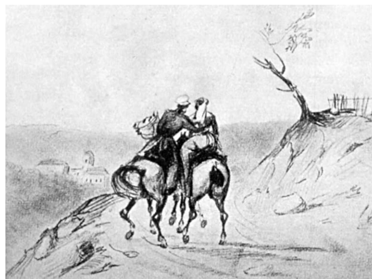
Рисунок из походного альбома М.Ю.Лермонтова.