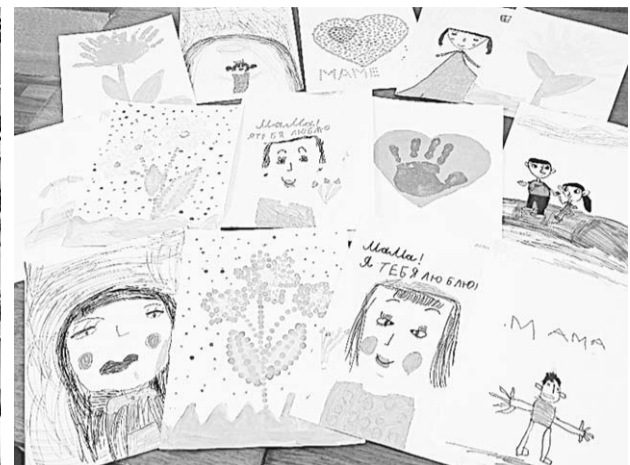
Вот такими видят ребята своих мам.

Подобные мероприятия прошли в Эртильском, Бутурлиновском и Лискинском районах.