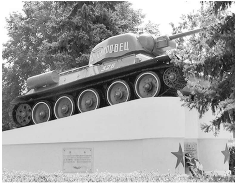
Танк Т-34 на постаменте памятника героям-танкистам в Кантемировке.

Невольно вспоминается первый парад после окончания Великой Отечественной войны. 7 ноября 1945 года в Москве во главе колонны гвардейской танковой Кантемировской дивизии шёл танк под № 460, в люке которого находился командир прославленного соединения Герой Советского Союза генерал-лейтенант П.П. Полубояров. На башне танка был изображён знак «Гвардия» с надписью «Кантемировец». А на борту машины расписан боевой путь корпуса от Воронежа до Праги. История и боевая судьба этого танка представляет интерес. Ведь машины, как и люди, имеют свою историю. Он был собран на