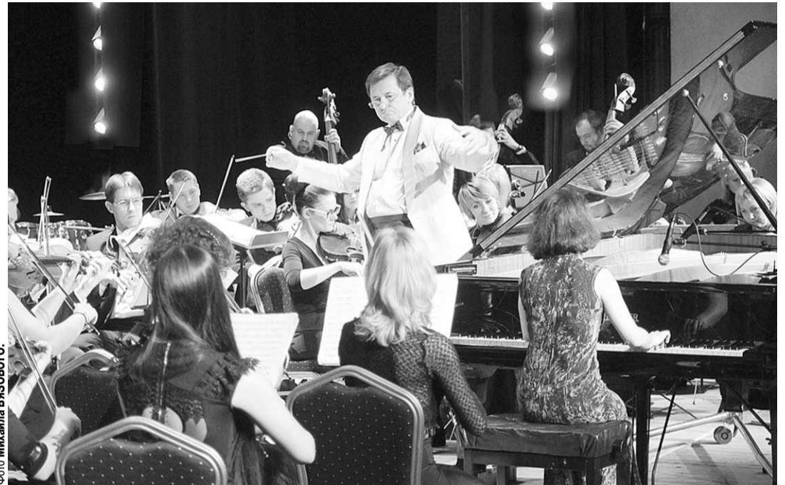
В Воронежском концертном зале звучит Моцарт.

– На моей памяти немного было таких серьёзных творческих инициатив, которые бы в полной мере состоялись в нашем городе и имели серьёзное влияние на