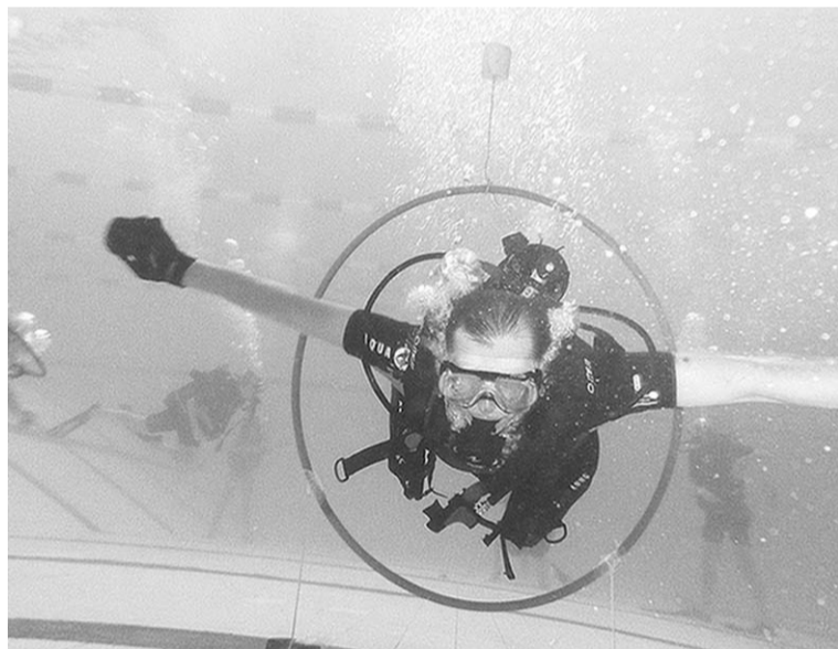
Подводное плавание доступно инвалидам.

lung, включал в себя только три дисциплины: сборку снаряжения и погружение в нем под воду на время, командную эстафету по перетягиванию себя по канату, натянутому под водой, а также «проплывание» через закрепленные на глубине гимнастические обручи. Это, однако, не слишком огорчило покорителей водных глубин, разделенных на команды «моржей» и «тюленей», которые с азартом принялись оспаривать