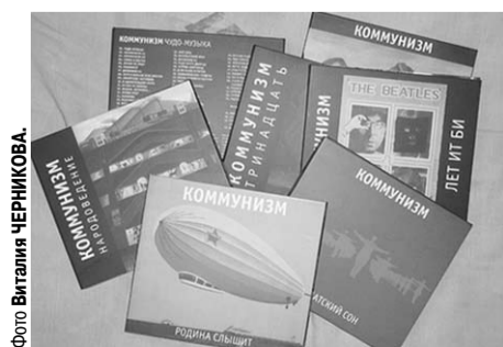
Каждый альбом «Коммунизма» был чем-то вроде очередной тома энциклопедии советской жизни.

Мы можем сказать только большое спасибо сибирякам за то, что они дали нам возможность ощутить безудержное веселье, которое помогает нам сохранить себя в потоке серьёзной бессмысленности. Ждем новых концертов в Воронеже.