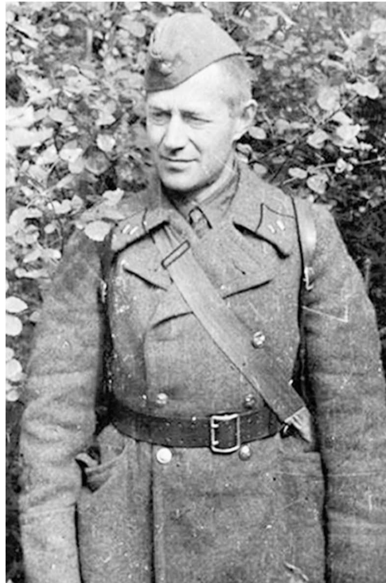
Алексей Сурков. Западный фронт, 1941 год.

Усердие ваше не по разуму. Слова ваши жалкие, лживые, мертвые. Есть у русского народа такая поговорка: «Целовал ястреб курочку до последнего перышка». Может быть, где-нибудь и попадались фашистским ястребам доверчивые