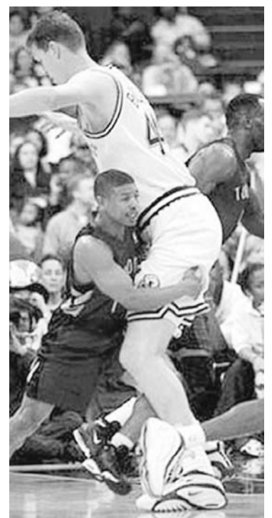
У нас про таких говорят: мал, да удал.

Популярность Тайрона «Магси» Богса была настолько велика, что в 1996 году он снялся вместе с другими звездами НБА Майклом Джорданом, Чарльзом Баркли и Патриком Юингом в комедийном фильме «Космический джем», в том же году принял участие в съемках фильма «Эдди» вместе с Вупи Голдбергом. Богс сыграл самого себя в одной из серий комедийного телесериала «Умерь свой энтузиазм», вместе с Чарльзом Баркли — в эпизоде одного из выпусков «Ночная жизнь в субботу» и в различных телешоу.