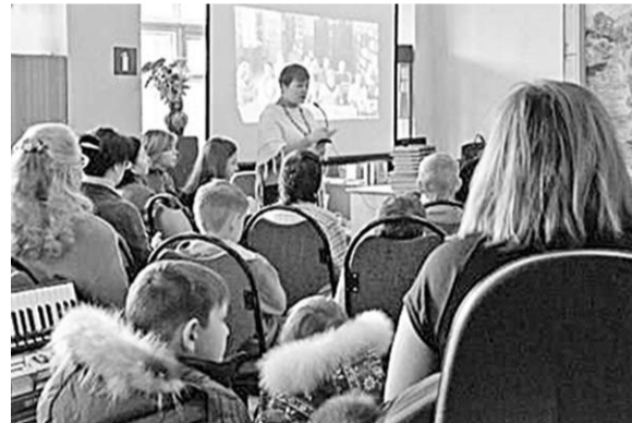
Во время онлайн-встречи.

Сотрудничество библиотек двух городов будет продолжено.