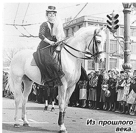
Из прошлого века.