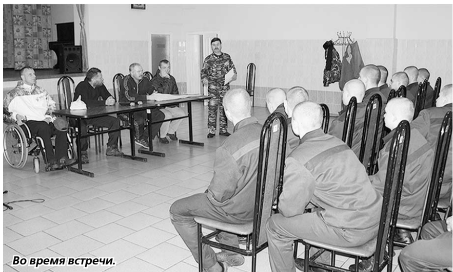
Во время встречи.