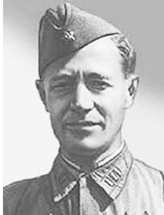
Алексей Сурков. 1942 год.