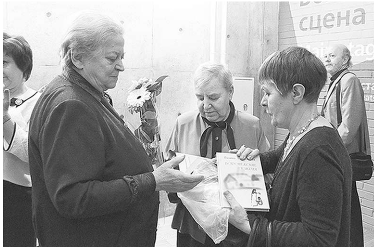
Поэт (справа) в окружении читателей.

В этом письме поэт, которому посвящены «Письма старому другу» (пять стихотворений и постскриптум), откликается на новую, восьмую и столь весомую, книгу Умывакиной: рано, мол, ещё издавать итоговую вещь. Замечая, впрочем: никто не скажет, что значит рано, что — поздно. Давно живущий в Америке,