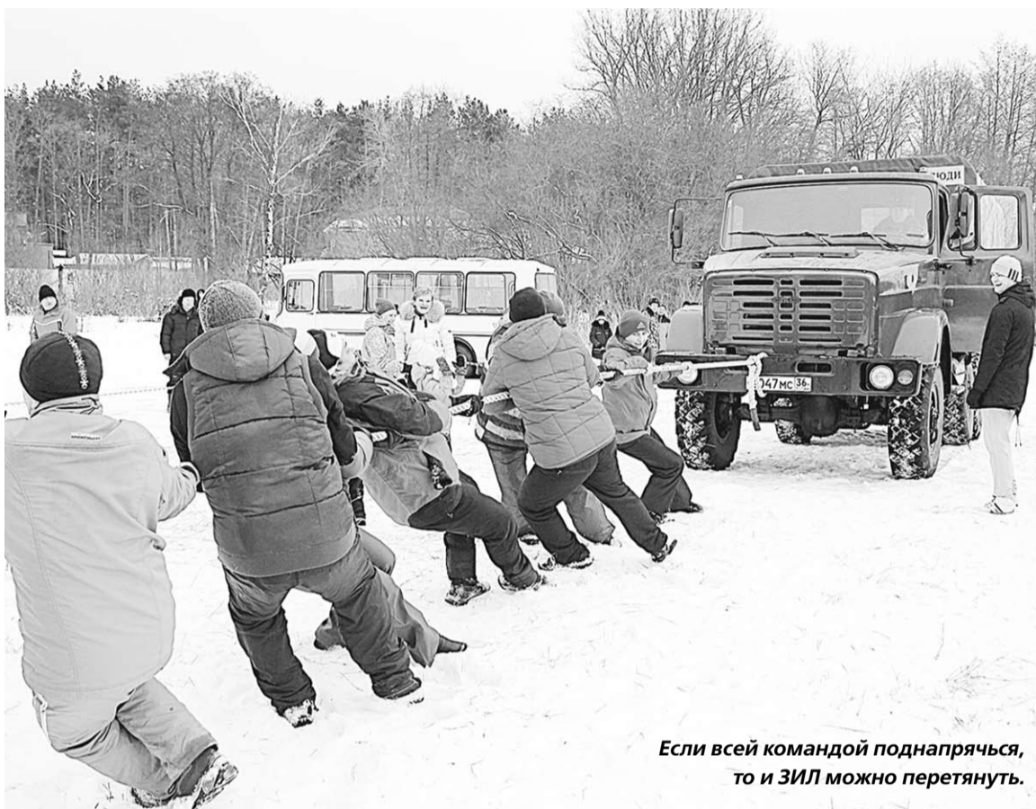
Если всей командой поднапрячься, то и ЗИЛ можно перетянуть.

На загородной учебной базе института ФСИН России прошёл ставший уже традиционным День здоровья