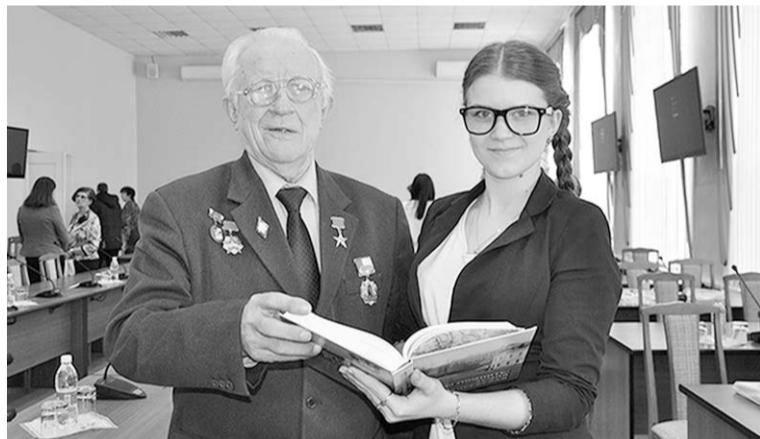
Новый сборник интересен и ветеранам, и молодёжи.