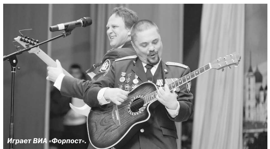
Играет ВИА «Форпост».