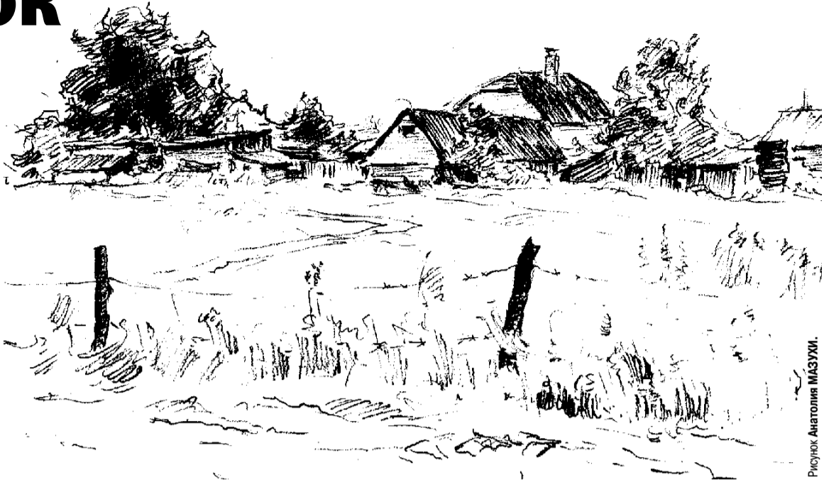
Рисунок Анатолия МАЗУКИ.