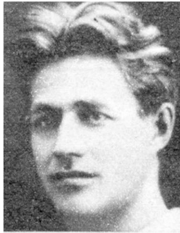
Алексей Сурков в молодые годы. Редкий снимок.

А именно: Придет и к нам победа, как награда За тернии жестокого пути, И нам с тобой к такому часу надо Тепло в солдатском сердце принести.