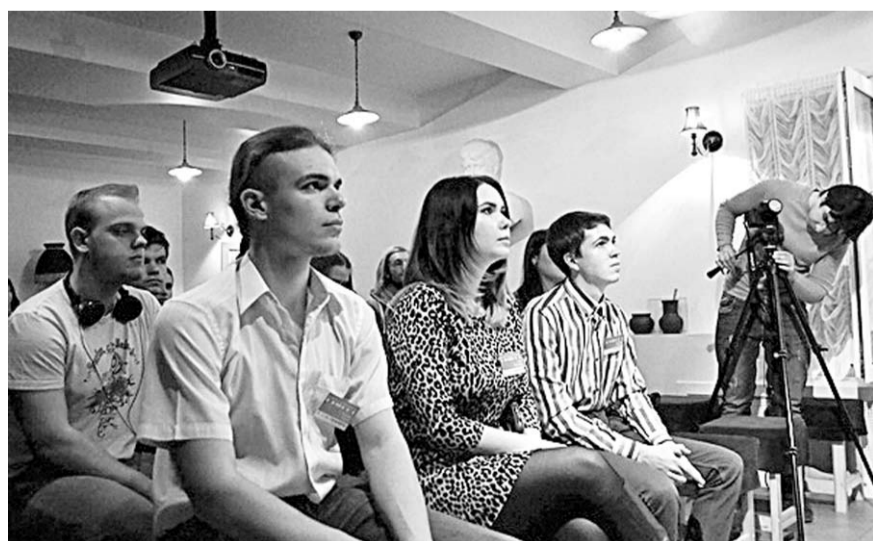
В один из фестивальных дней.

Не менее важной частью фестивальной программы в этом году стала дискуссия о путях развития городского туризма и использования городского пространства для реализации культурных проектов. Была затронута и такая тема, как развитие творческих кластеров в других городах и странах.