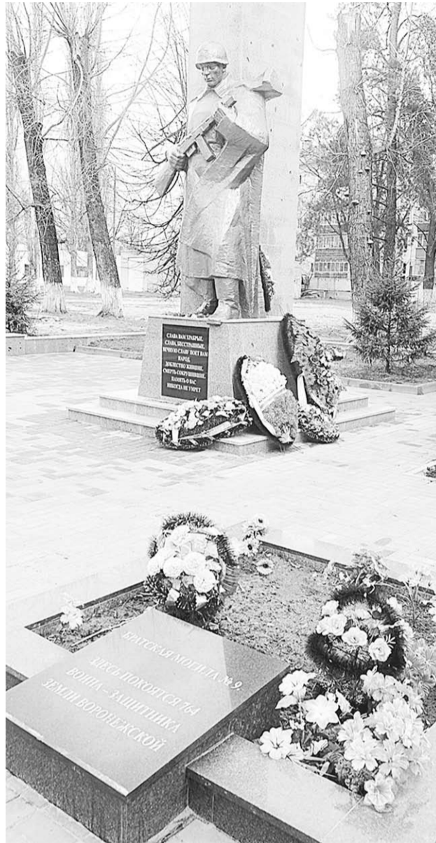
В непосильных трудах, бесконечных боях Мы погибли бы, если б не погибли...

Мы бы в наших лесах затерялись навек, Захлебнулись простором Великой Равнины, Если б ведали страх, обратились бы в прах, Из которого после поднялись едва ли,