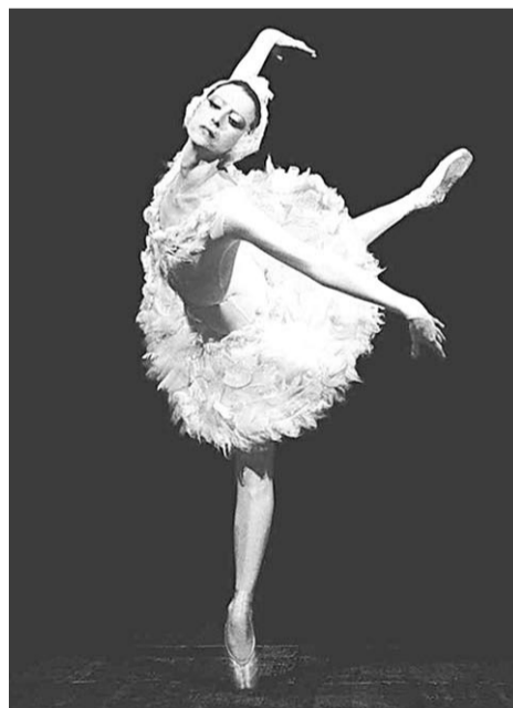
На сцене – великая балерина.

Дебютировала семнадцатилетняя Майя Плисецкая в Большом театре в популярнейшем спектакле «Лебединое озеро» - в партии одного из шести лебедей, а вскоре убедительно и проникновенно исполнила вариации из «Дон Кихота» Минкуса, партии Мирты в «Жизели» и феи Сирени в «Спящей красавице». В 1944 году Плисецкая впечатляюще станцевала партию Маши в «Щелкунчике», а в 1945-м создала романтический образ Раймонды, отмеченный