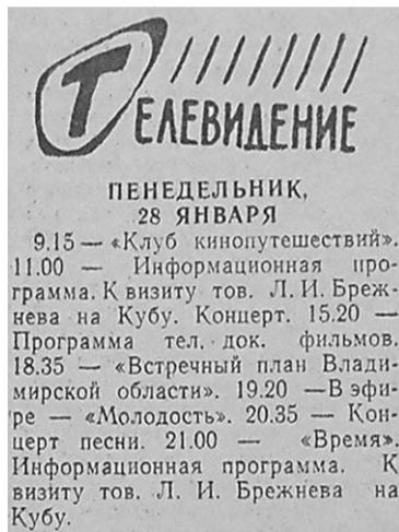
Типичная телепрограмма 1974 года.