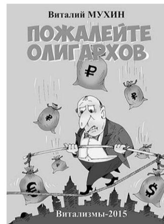
...и его книга.