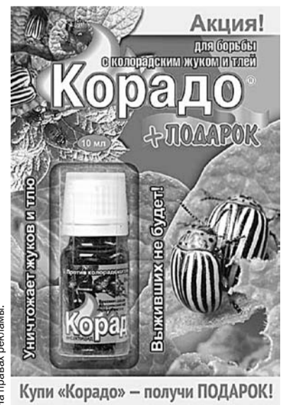
На правах рекламы.