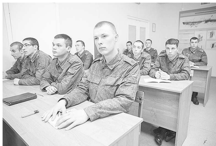
Проблемы экологии небезразличны курсантам.