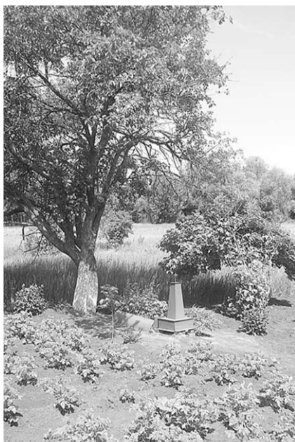
Могилы Олега Дробного.