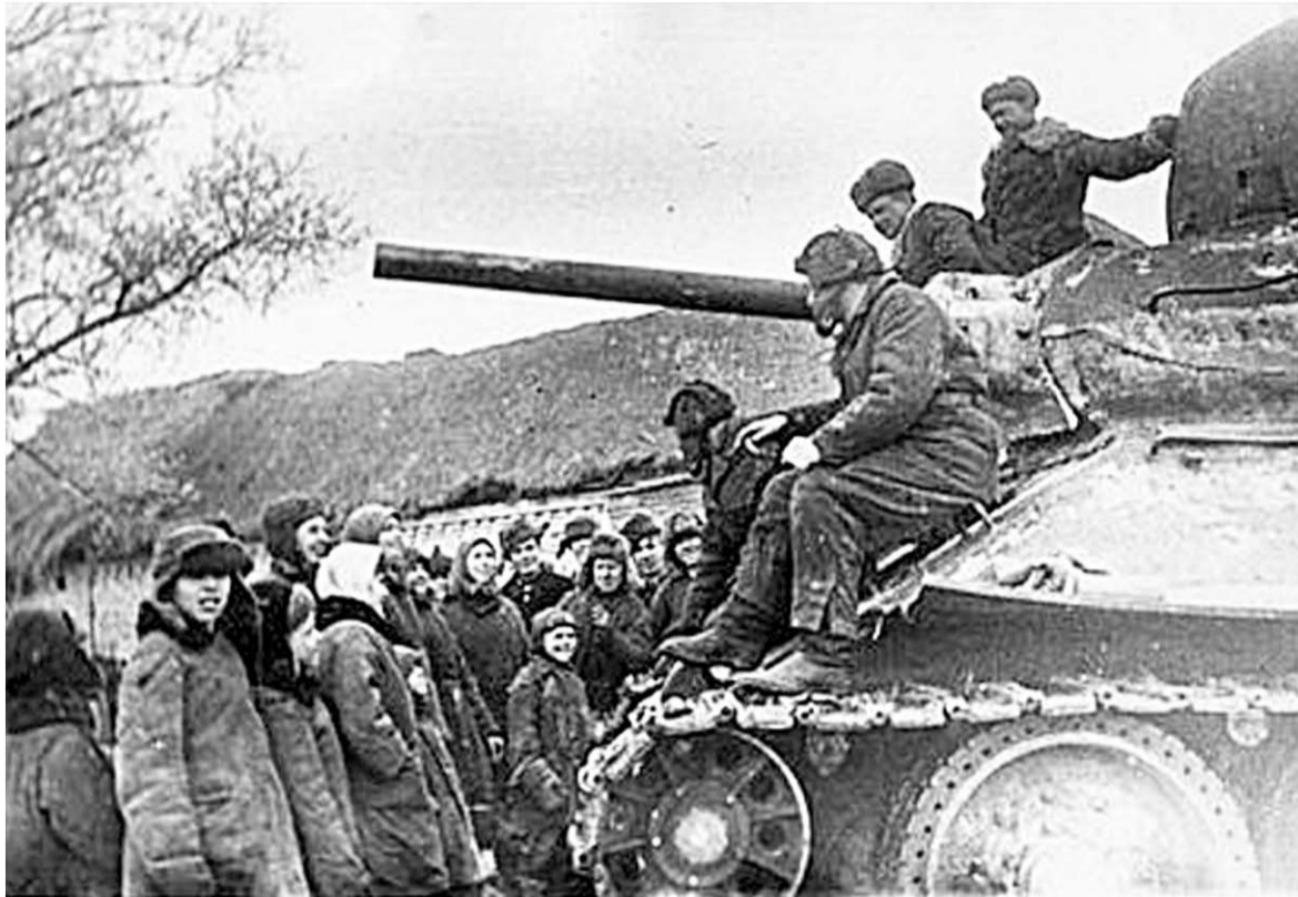
Жители села Твердохлебово встречают танкистов 24-го танкового корпуса генерал-лейтенанта В.М. Баданова.

Фашисты так и не узнали, кто руководил отрядом, они думали уже о другом - как быстрее спасти свою