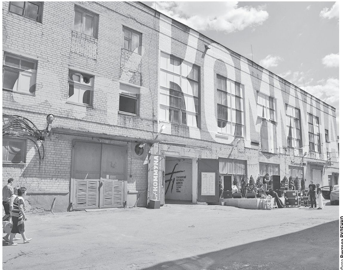
Здание бывшей типографии в дни фестиваля не однажды становилось одной из главных его площадок, где проходили выставки и творческие встречи с писателями, переводчиками, исследователями наследия Платонова. Июнь 2015 года.