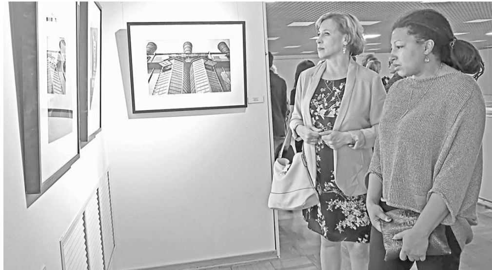
Первые посетители выставки.

На фестивальной выставке воронежский зритель может увидеть несколько серий фотографий, посвящённых жизни московских заводов: «АМО» и «МОГЭС», на которых производилась сборка автомобилей, а также электрические лампочки и собирались генераторы для электростанций. Внимательно изучив снимки Родченко, можно понять,