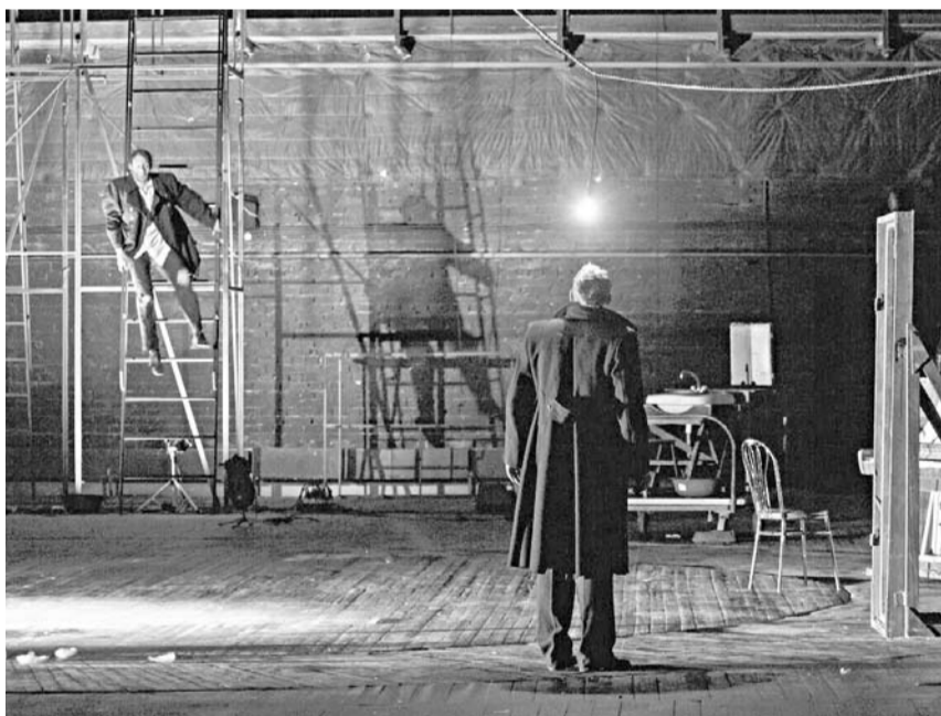
Сцена из спектакля «Макбет. Кино».