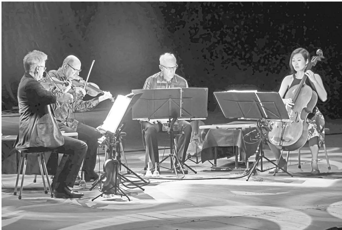
Kronos Quartet продемонстрировал разные способы извлечения музыки.

— Все эти композиции будут доступны на нашем сайте, — пообещал Дэвид Харрингтон. — Их можно будет скачать абсолютно бесплатно. С ноября 2016 года музыканты из 78